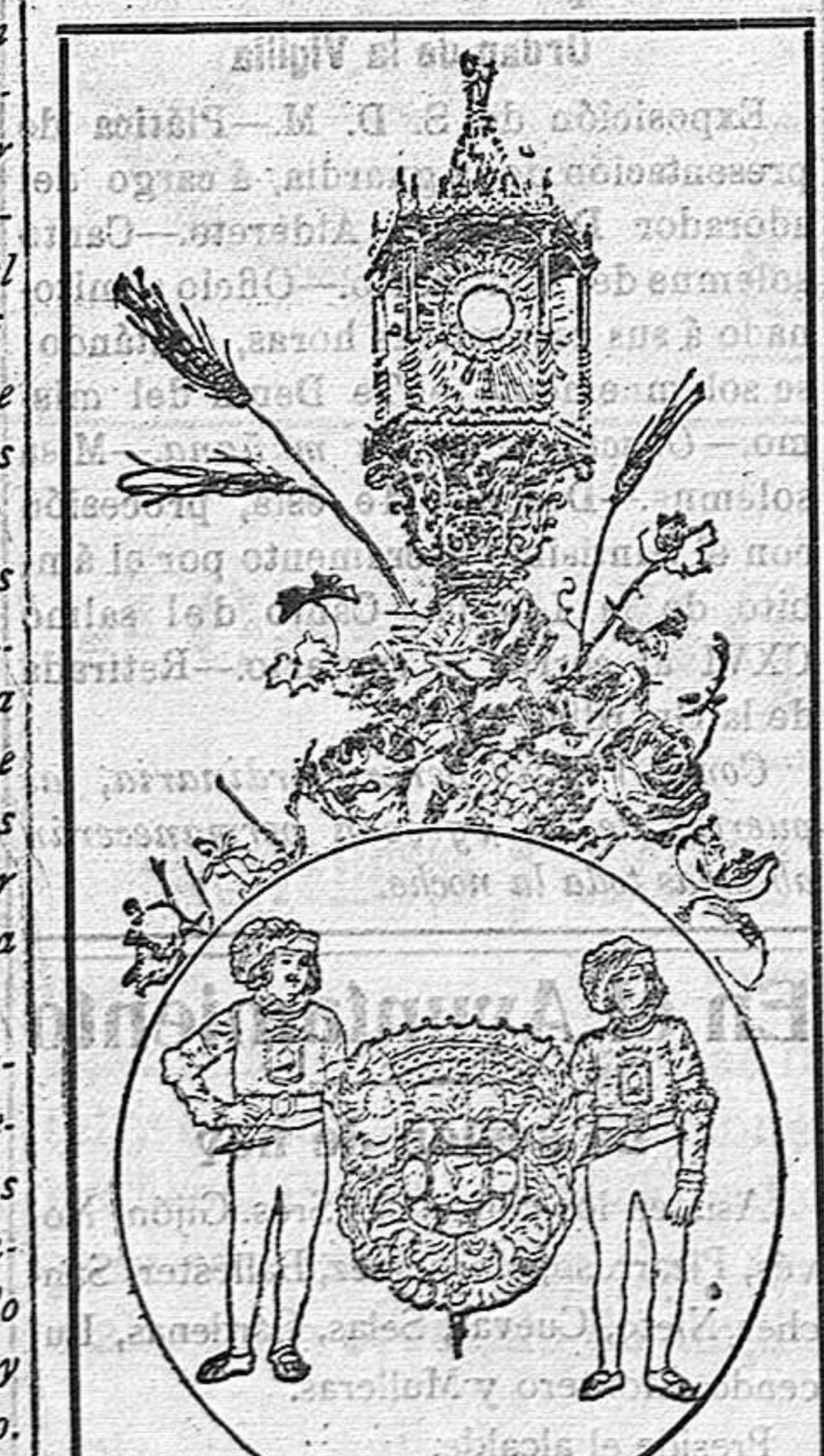
Custodia que figura en la procesión del Corpus Christi de Granada.—Heróico escudo de los Reyes Católicos que sale en la misma procesión.

Sin revestir los caracteres de estueta y daga animación que distingue a las fiestas de otras capitales andaluzas, y no se