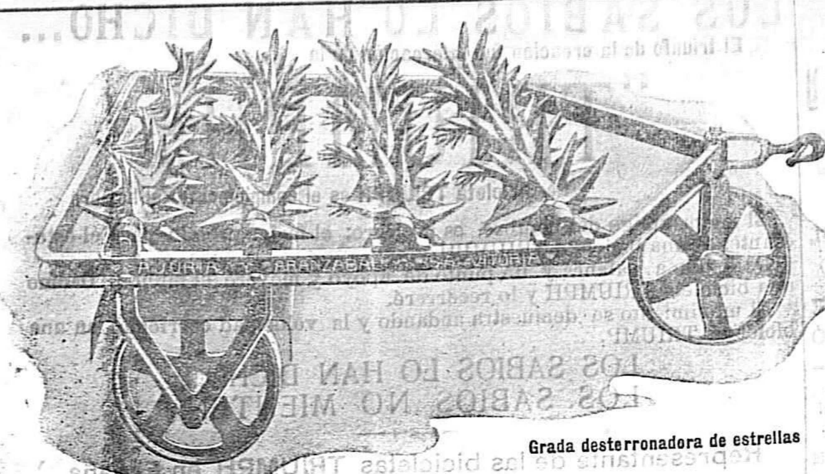
Grada desterronadora de estrellas

PIDAN CATÁLOGOS VISITAR NUESTRA SUCURSAL DE CIUDAD REAL CALATRAVA, 5