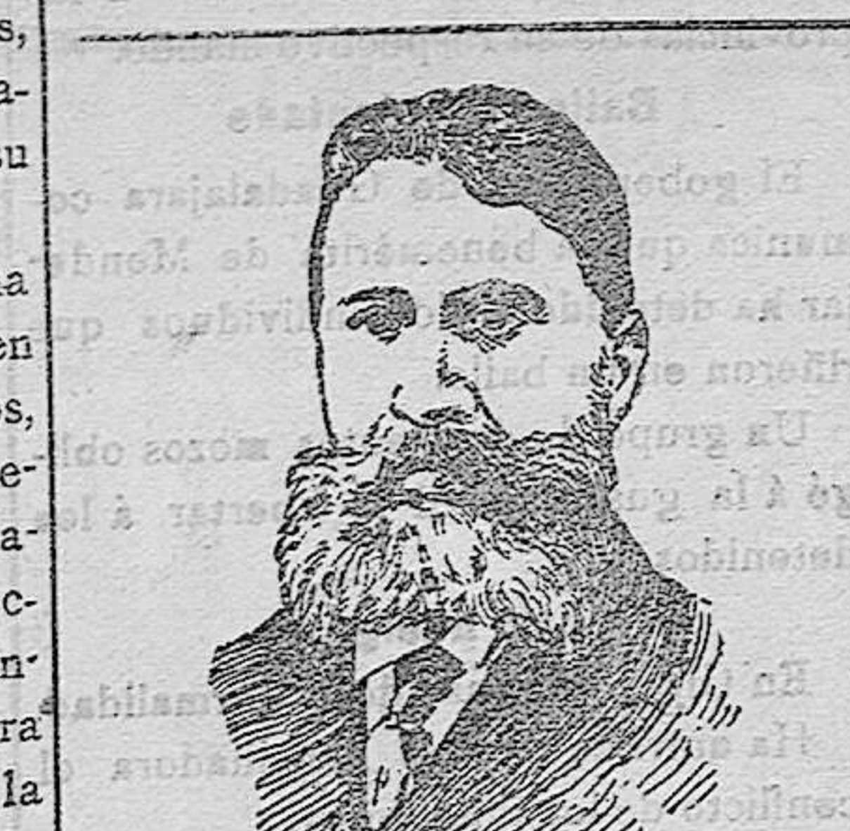
MR. RADOSLAVOFF, PRESIDENTE DEL CONSEJO DE MINISTROS DE BULGARIA.

El gobierno debe preocuparse del problema y poner en acción todos los medios para hacer menos difícil la situación del país.