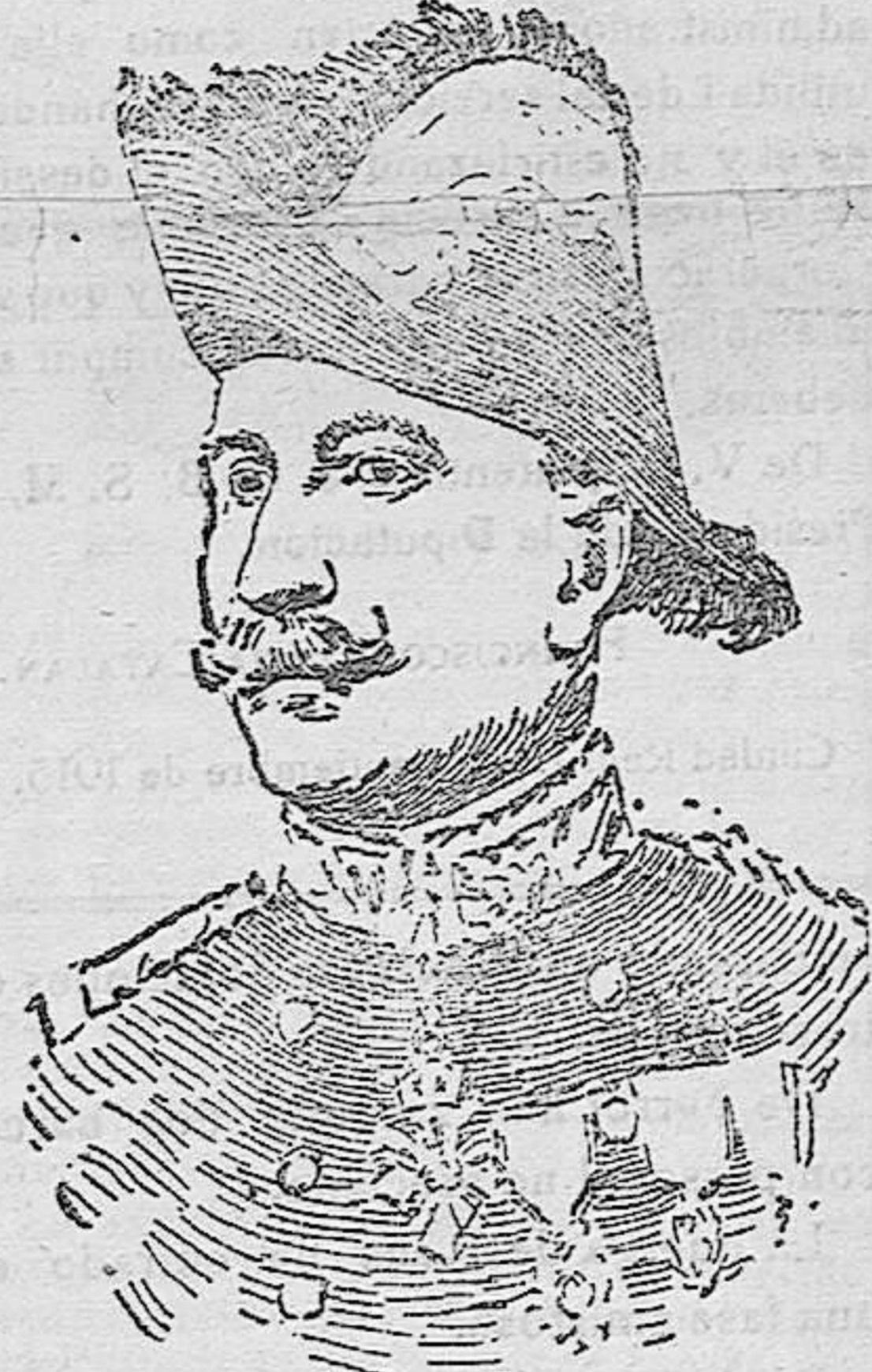
GENERAL FRANCÉS MOID HUY A CUYAS ÓRDENES OPERAN EN LOS VOSGOS LOS CAZADORES ALPINOS LLAMADOS POR LOS ALEMANES «DIABLOS AZULES»

rompieron había sido preparado durante la paz, y, aunque injustificadamente retrasado algunos días, lo inspiró una buena estrategia. Esta labor en época de paz realizábase desde el punto de vista de que los probables centros de gravedad de las fuerzas enemigas en lucha se reducirían a uno solo, y sobre éste concentráramos lo más pronto posible todas las fuerzas de que disponíamos.