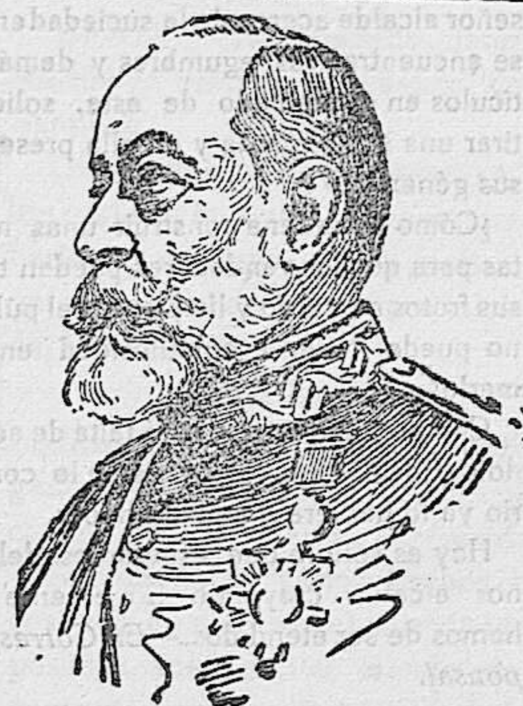
EL ILUSTRE GENERAL MARINA RESIDENTE GENERAL DIMISIONARIO EN MARRUECOS, A QUIEN HA SIDO OTORGADA LA CRUZ DE SAN FERNANDO, LA MAS PRECIADA RECOMPENSA DEL EJERCITO, POR LOS EXCELENTES SERVICIOS PRESTADOS A LA PATRIA