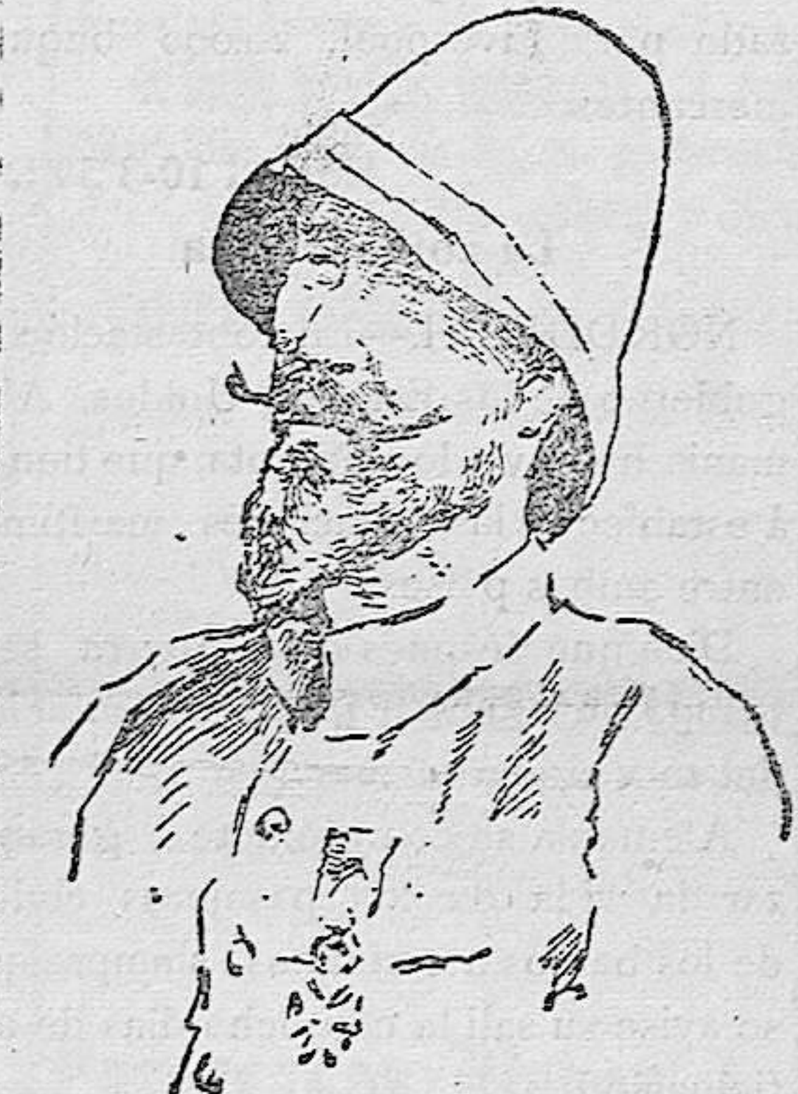
GENERAL FRANCÉS GOURAUD, RELEVADO DEL MANDO DE LAS TROPAS DE DESEMBARCO EN LOS DARDANELOS, POR HABERLE DESTROZADO UN BRAZO Y FRAC TURADO AMBAS PIERNAS UNA GRANADA DE LOS TURCOS