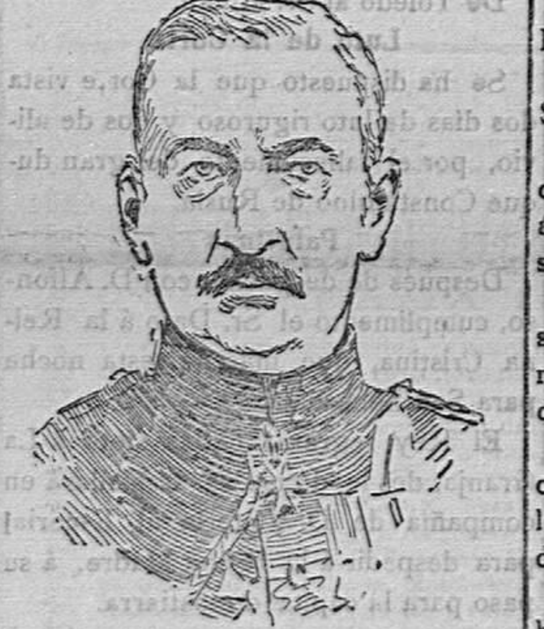
Figuras de la guerra GENERAL VON LINSINGEN, UNO DE LOS CAUDILLOS ALEMANES VICTORIOSOS EN LA GATLIZIA OCCIDENTAL.