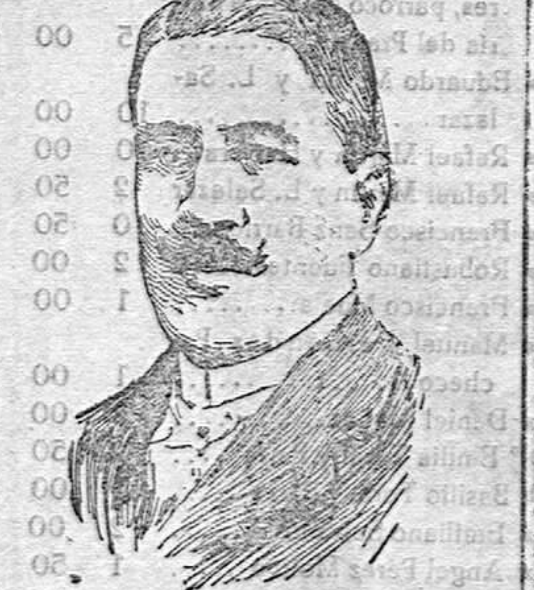
EL PRESIDENTE DEL CONSEJO DE MINISTROS DE PORTUGAL, JOAO CHAGAS VICTIMA DE UN ATENTADO CRIMINAL AL DIRIGIRSE A LISBOA.