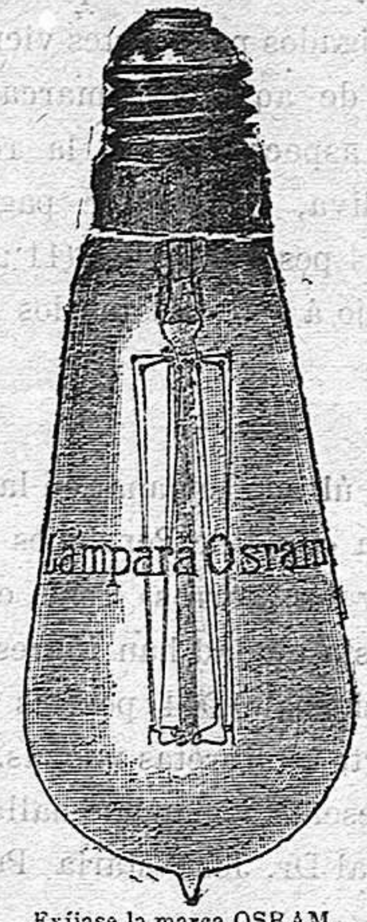
Exíjase la marca OSRAM grabada en el cristal

GRANDE Y VARIADO SURTIDO DE CALZADO CON SUELA DE GOMA 2 Rambla Libertad 2 ZAPATERIA DE MALARE