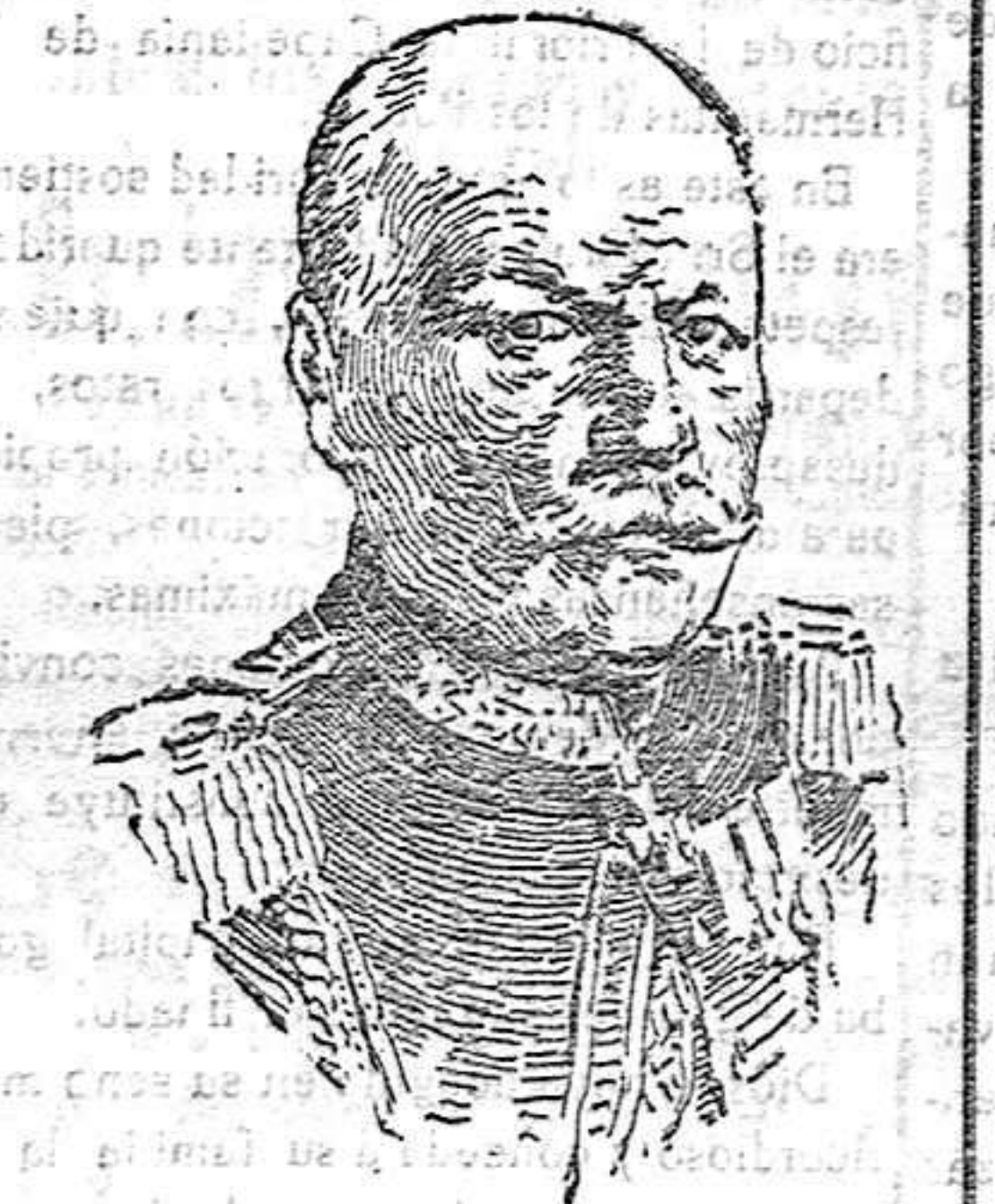
EL GENERAL ALEMAN LOCHON, A QUIEN HA SIDO OTORGADA LA CRUZ DE HIERRO POR SU COMPORTAMIENTO EN LOS COMBATES DE SOISSON DE ENERO ULTIMO.