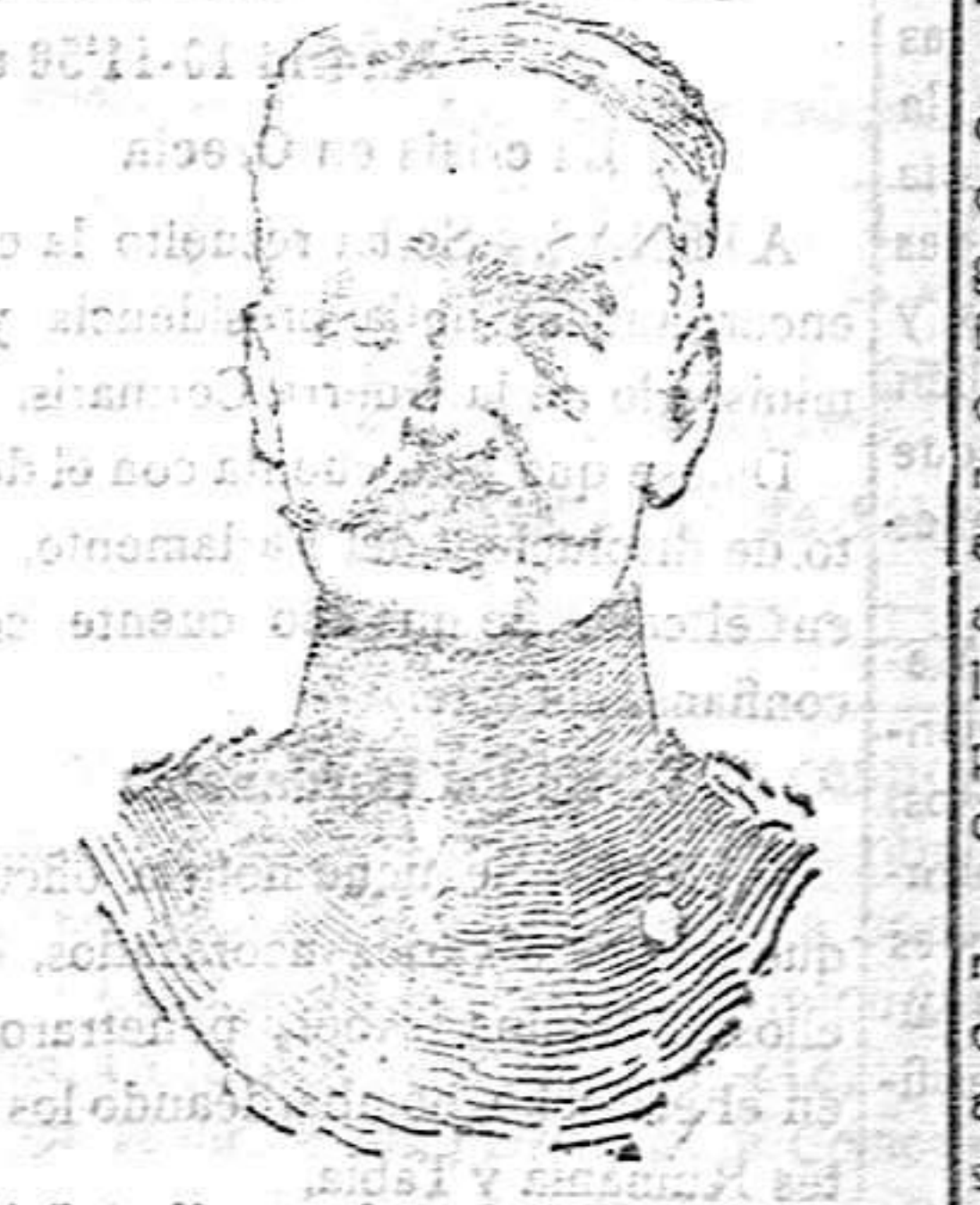
GENERAL MUDRA COMANDANTE EN JEFE DEL XVI CUERPO DEL EJERCITO ALEMAN A QUIEN HA SIDO CONCEDIDA LA CRUZ «POUR LO MERITO»