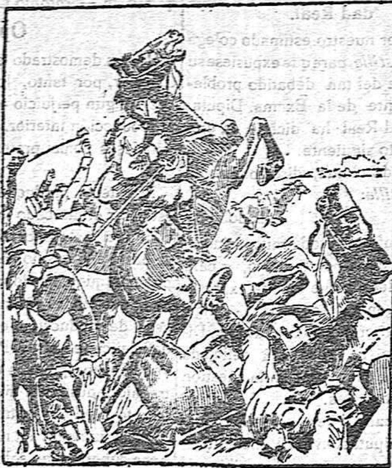
Caballería inglesa detenida durante una carga por el fuego de las ametralladoras alemanas

ta exministros y hombres del «bloco», como Hanotaux, Delouche, el presidente de la Cámara Deschanel y tantos otros que prestaron su complicidad a la persecución, y hoy lo deploran, arrepentidos. Todos formulan el mismo voto, todos abrigan el mismo deseo: todos menos los que forman el elemento oficial, todos menos los que ejercen el poder. La corriente es tan irresistible, tan erradora, que no se atreven a ir contra ella de una manera abierta y descarada, pues ningún periódico francés insertaría su protesta. Se limitan, pues, a desahogos vergonzantes en la Prensa extranjera, insinuando que son, ante todo, representantes de los intereses nacionales, que necesitan hacer una política realista, y no idealista, y que la realidad les fuerza a no someterse a divagaciones y extravíos de la opinión. A este misarable argumento, que constituye una blasfemia, no solo en el sentido religioso, sino en el patriótico, acaba de dar cumplida respuesta el más realista—realista hasta la ferocidad—de todos los pueblos, Inglaterra, cuya autoridad nadie menos que Francia puede recusar en estos momentos. Respuesta que ha sido doble; y que epísta por completo a Poincaré, a Viviani y a todos los supuestos realistas de su especie. Como será fácil demostrar. FRANCISCO MELGAR. París, Enero 1915.