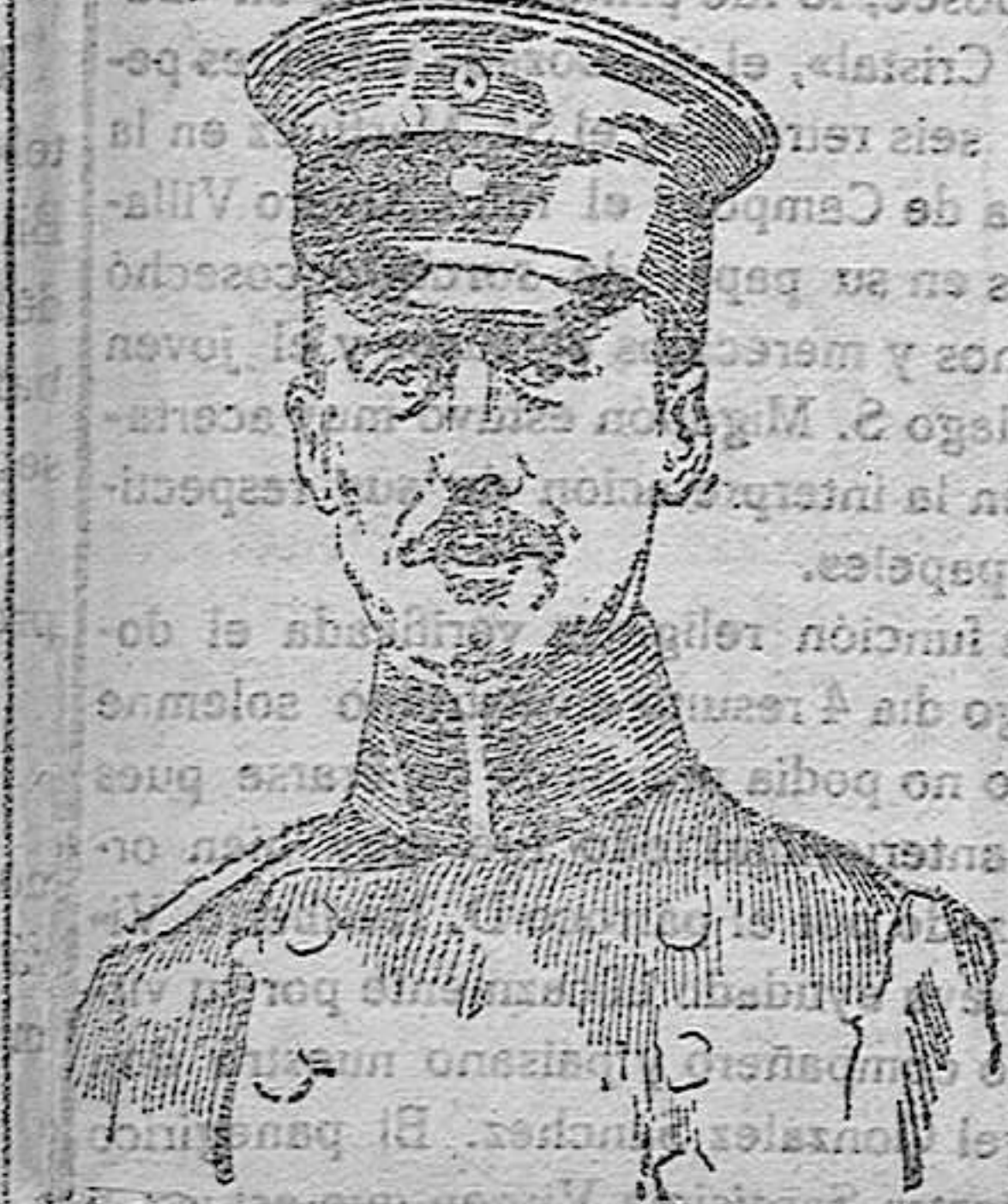
EL PRINCIPE OSCAR DE PRUSIA, HIJO TERCERO DE GUILLERMO II, GRAVEMENTE ENFERMO DE UN ATAQUE CARDIACO, Á CONSECUENCIA DE LAS IMPRESIONES DE HORROR RECIBIDAS EN LOS COMBATES DEL OISE.