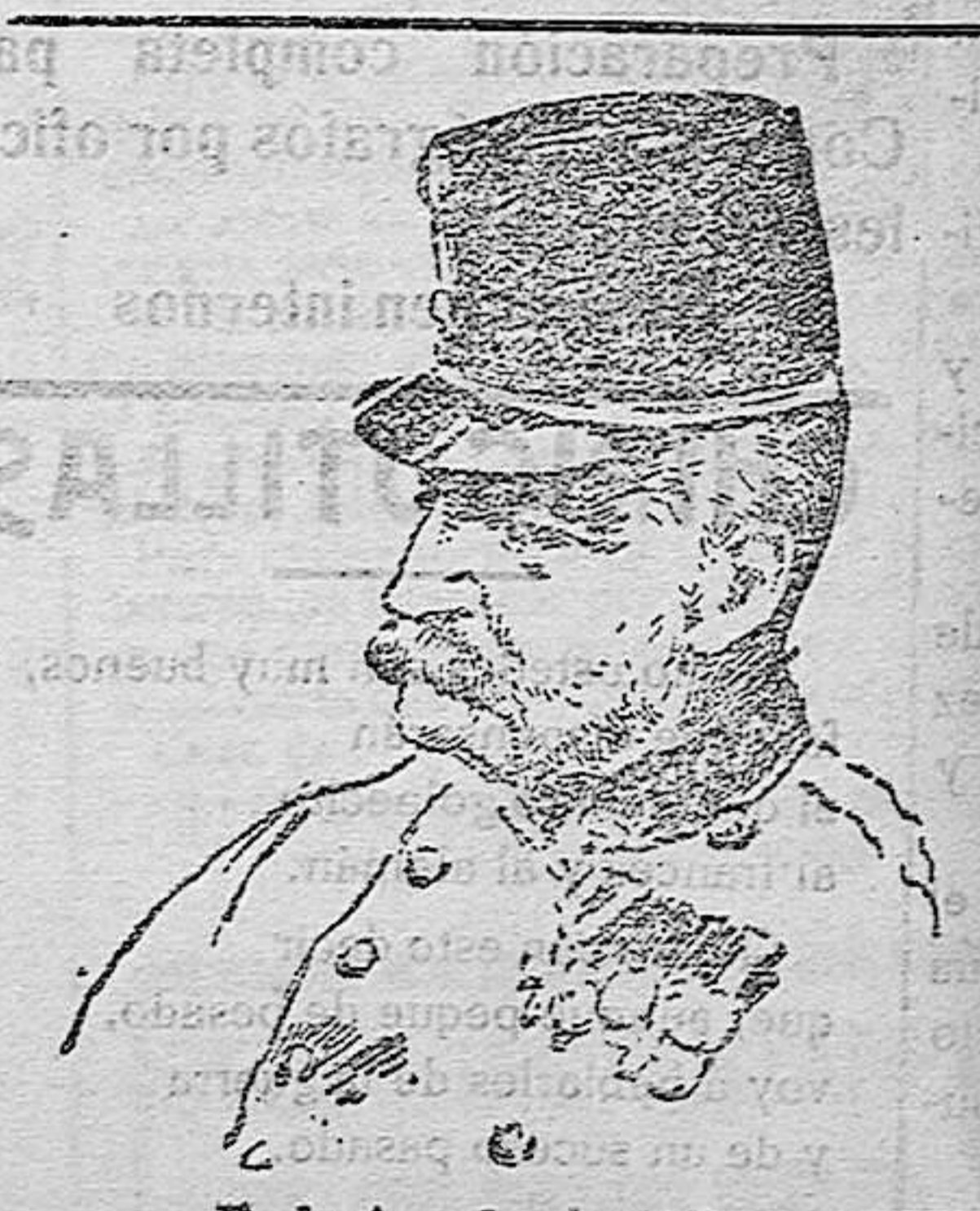
RODOLFO DE AUSTRIA ARCHIDUQUE GENERALISIMO DE LOS EJERCITOS AUSTRO-HUNGAROS

Austria viene fortificando las bocas de Cattaro, desde 1815, y las cimas dominan á Montenegro, con una altura de dos mil metros.