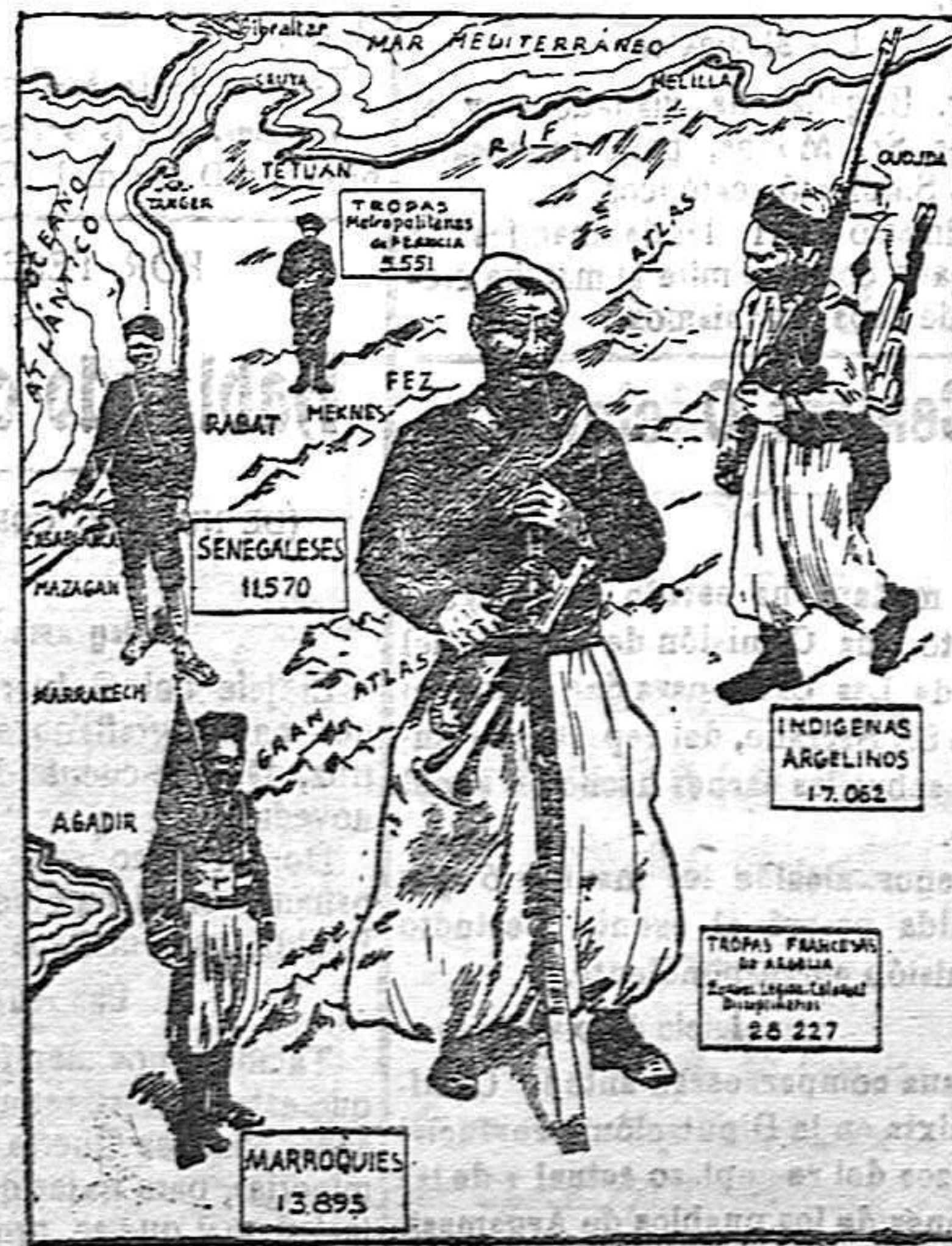
Gráfico de las fuerzas que Francia mantiene en Marruecos

En EL PUEBLO MANCHEGO se hacen trabajos tipográficos y de encuadernación de todas clases; desde los más sencillos á los más complicados. Precios económicos.