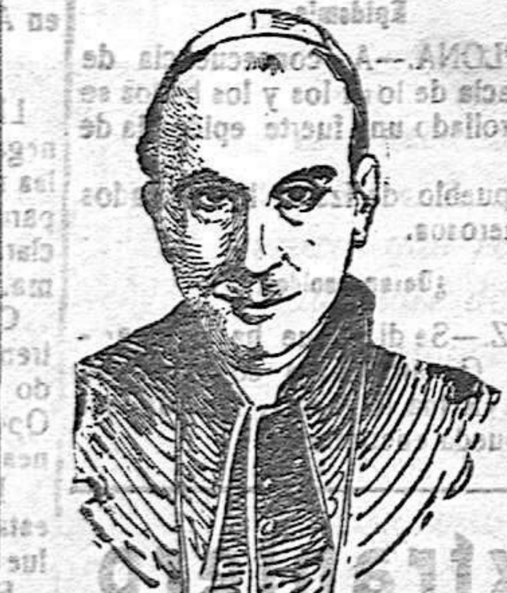
MONSEÑOR MERRY DEL VAL, NOMBRADO POR SU SANTIDAD PIÓ X ARCEBISPO DE LA BASILICA DE SAN PEDRO, CARGO VACANTE POR FALLECIMIENTO DEL CARDENAL RAMPOLLA.