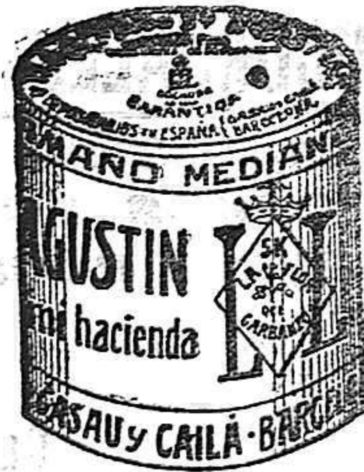
Garbanzo Sauced (5 Kilos)

Garantizamos al público que los comestibles empaquetados con nuestra marca son naturales de la planta, y sin contener la más pequeña adulteración en beneficio de ellos ni para hermostrarlos, por lo cual nos hacemos responsables á todo análisis que quiera efectuarse.