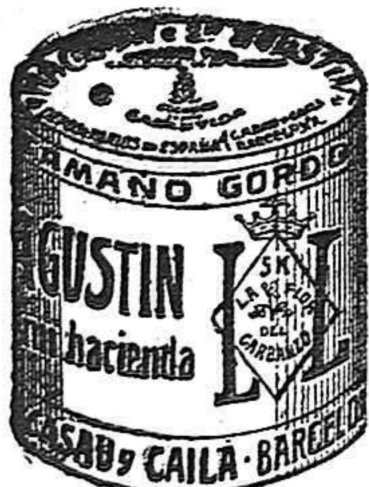
Garbanzo Sauced (5 Kilos)

Las esquelas mortuorias para insertorlas en LA LUCHA se admiten hasta las 3 de la tarde las de la 1.ª página y las de la 2.ª y 3.ª hasta las 5.