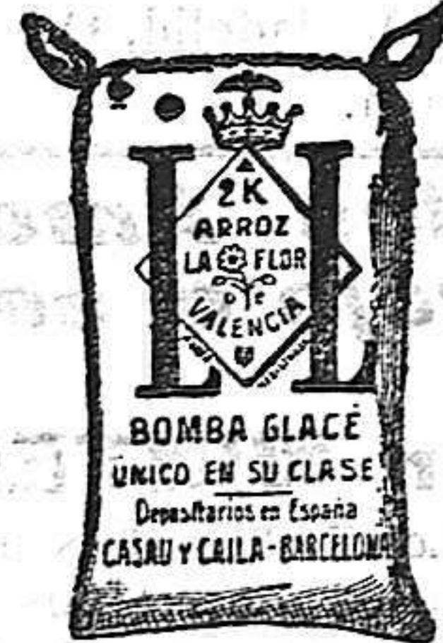
Bomba Glacé (2 Kilos)