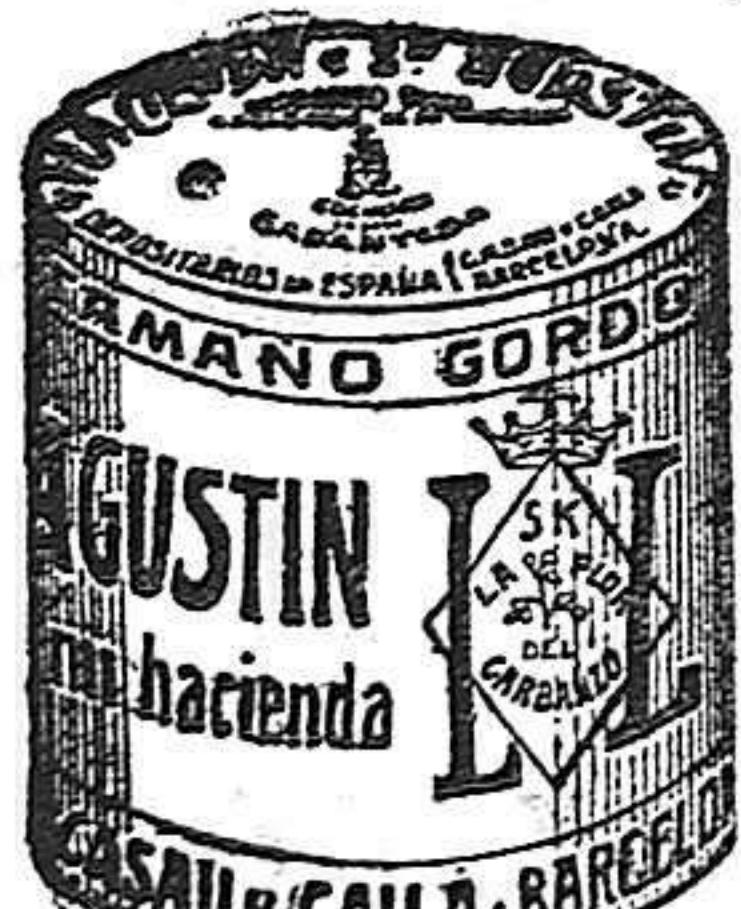
Garbanzo Saucot (5 Kilos)

Las esquelas mortuorias para insertorlas en LA LUCHA se admiten hasta las 3 de la tarde las de la 1.ª página y las de la 2.ª y 3.ª hasta las 5.