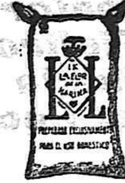
Harina Frappé (1 Kilo)