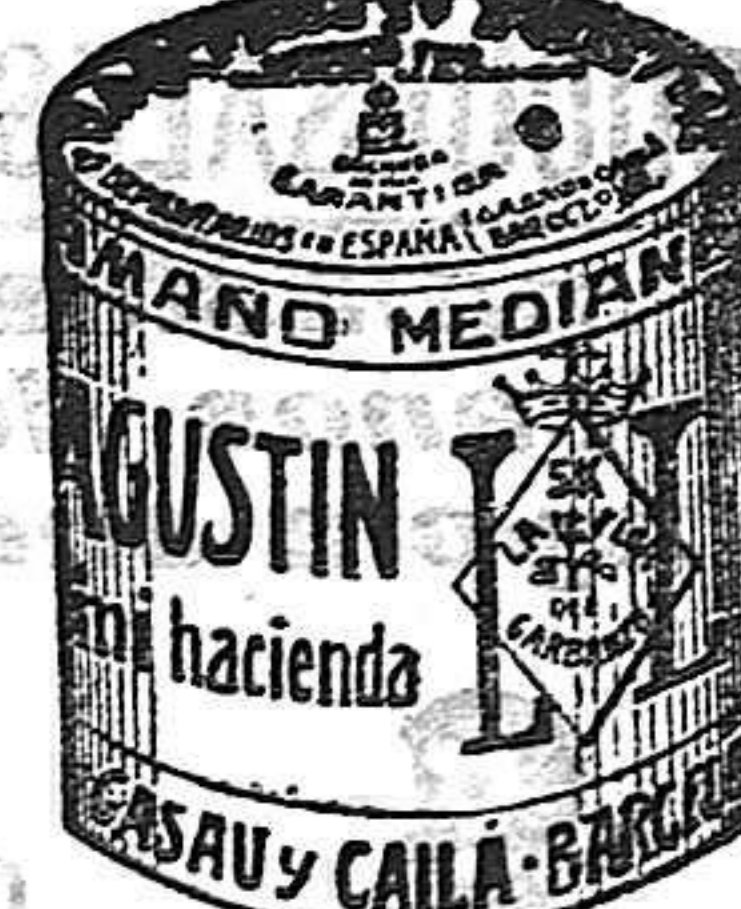
Garbanzo Saucot (5 Kilos)

Garantizamos al público que los comestibles empaquetados con nuestra marca son naturales de la planta, y sin contener la más pequeña adulteración en beneficio de ellos ni para hermostrarlos, por lo cual nos hacemos responsables á todo análisis que quiera efectuarse.