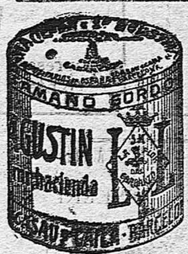
Garbanzo Sauce (5 Kilos)