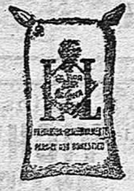
Harina fraga (1 Kilo)