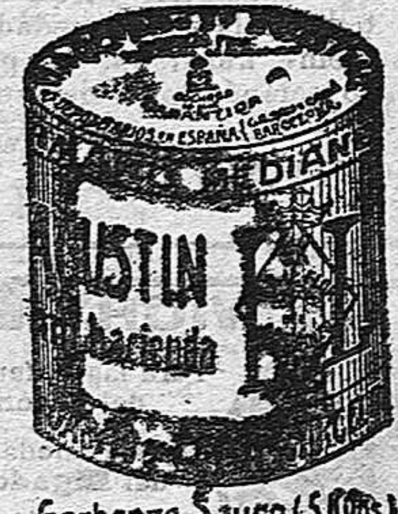
Garbanzo Sauce (5 Kilos)

Garantizamos al público que los comestibles empaquetados con nuestra marca son naturales de la planta, y sin contener la más pequeña adulteración en beneficio de ellos ni para hermosarlos, por lo cual nos hacemos responsables a todo análisis que quiera efectuarse.