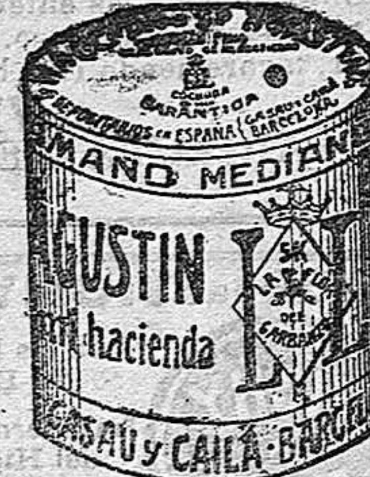
Garbanzo Sauco (5 Kilos)

Garantizamos al público que los comestibles empacados con nuestra marca son naturales de la planta, y sin contener la más pequeña adulteración en beneficio de ellos ni para hermostrarlos, por lo cual nos hacemos responsables a todo análisis que quiera efectuarse.