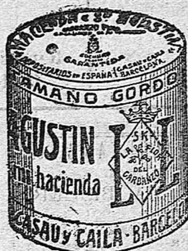
Garbanzo Sauco (5 Kilos)