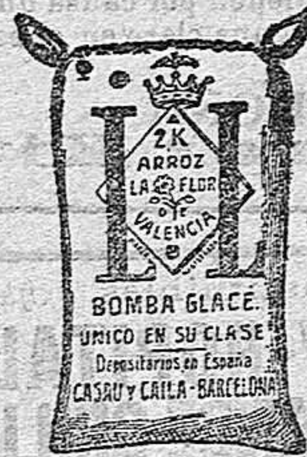
Arroz Glacé (2 Kilos)