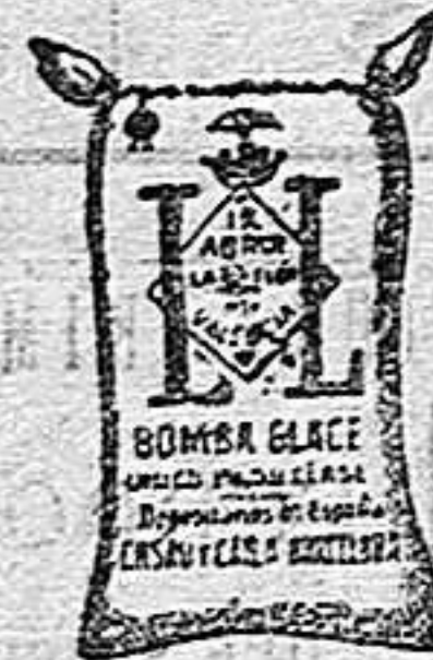
Arroz Glacé (1 Kilo)