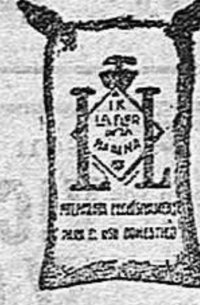
Harina fragada (1 Kilo)