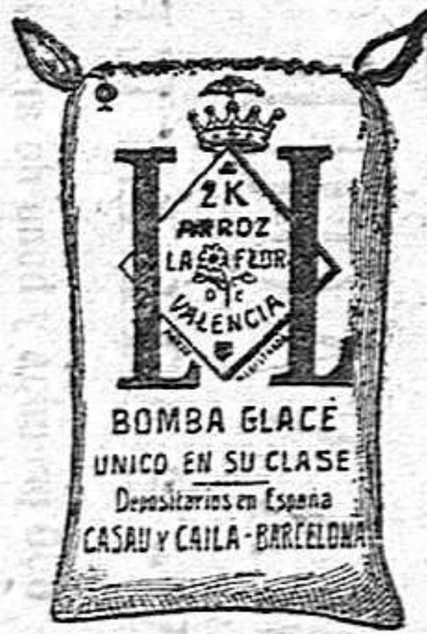
Arroz Glacé (2 Kilos)