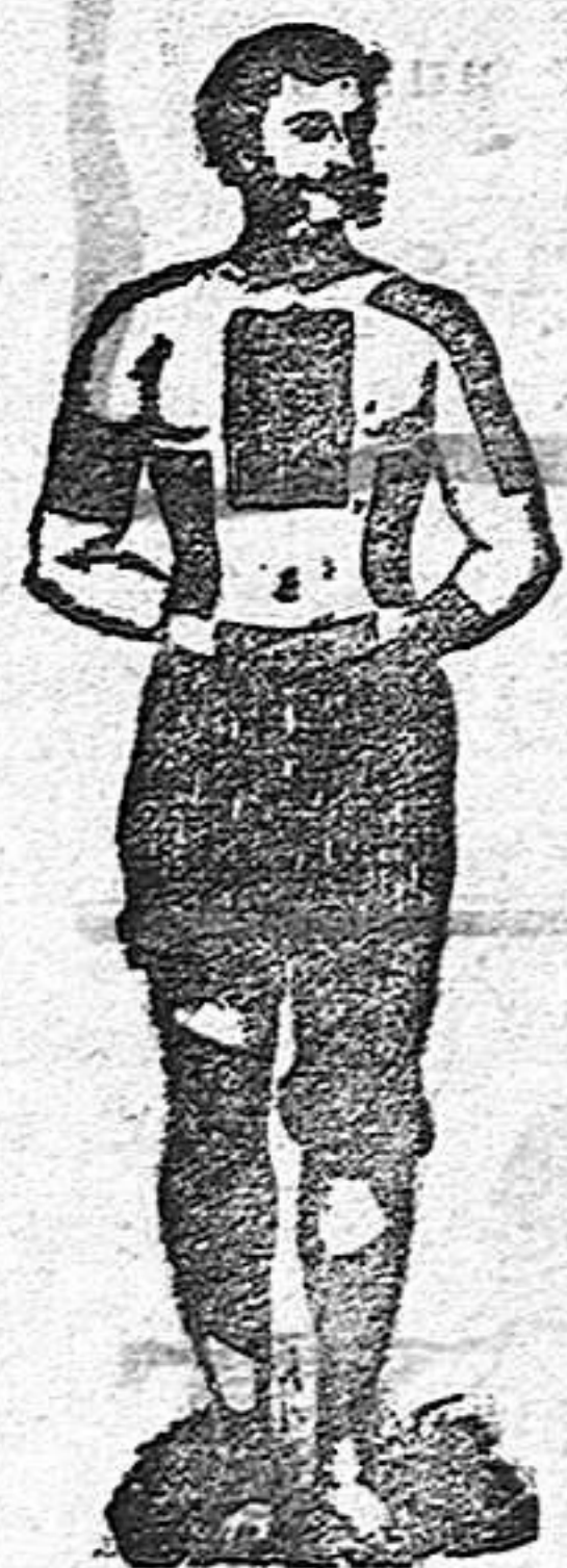
Este tipo Registrado.