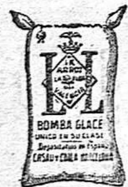
Arroz Glacé (1 Kilo)