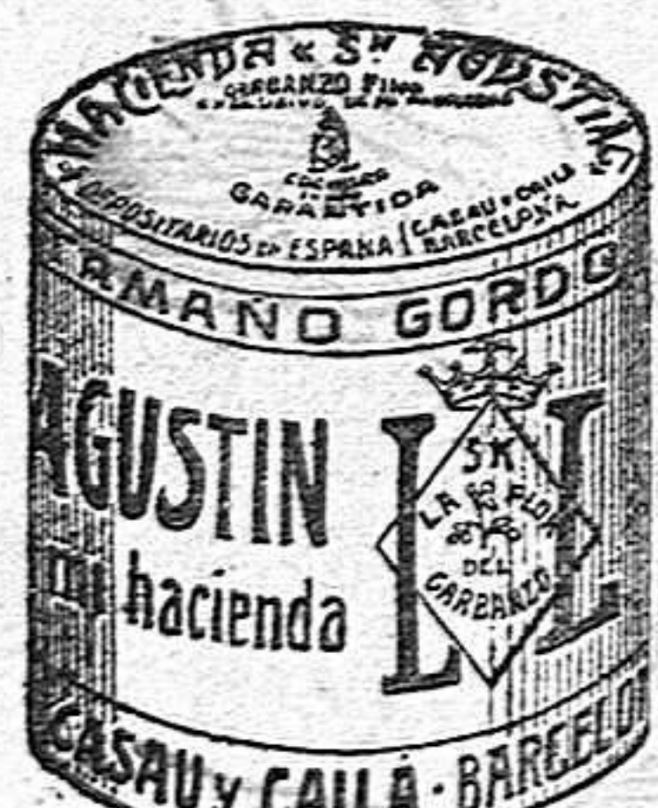
Garbanzo Sauco (5 Kilos)