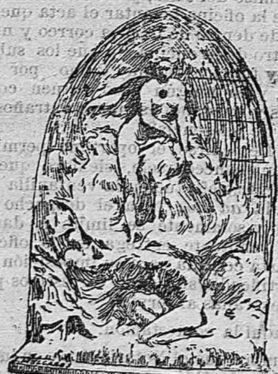
LA FUENTE DE LOS AMIGOS DE LAS ARTES

Estas corporaciones vienen prestando muy buenos servicios a la cultura en general, pues cuando en alguna ciudad faltan monumentos públicos, ellas cuidan de promover su erección, y si los que hay están deteriorados, procuran que se los restaure acertadamente.