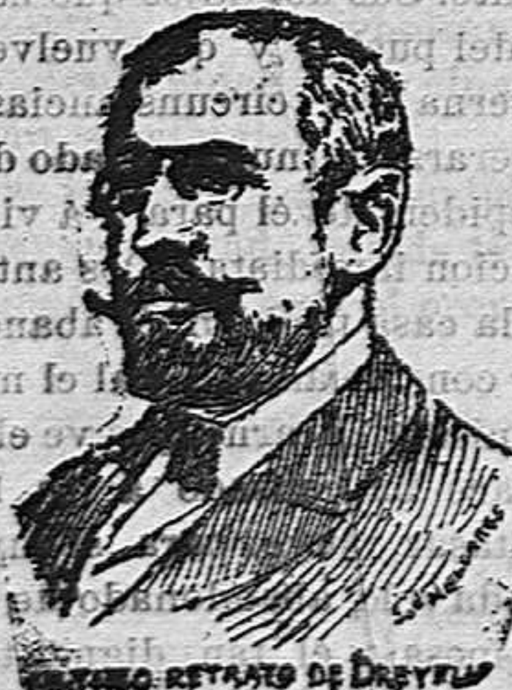
REtrato de Dreyfus

na, la que la erró con él, le dá, en licita compensación, lo más que puede.