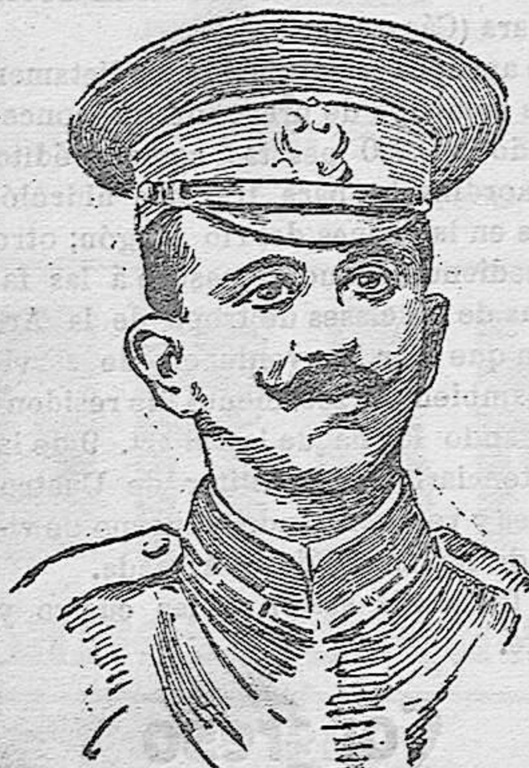
El príncipe Danilo, de Montenegro JEFE DE LAS FUERZAS QUE SOSTIEN SOUTARI