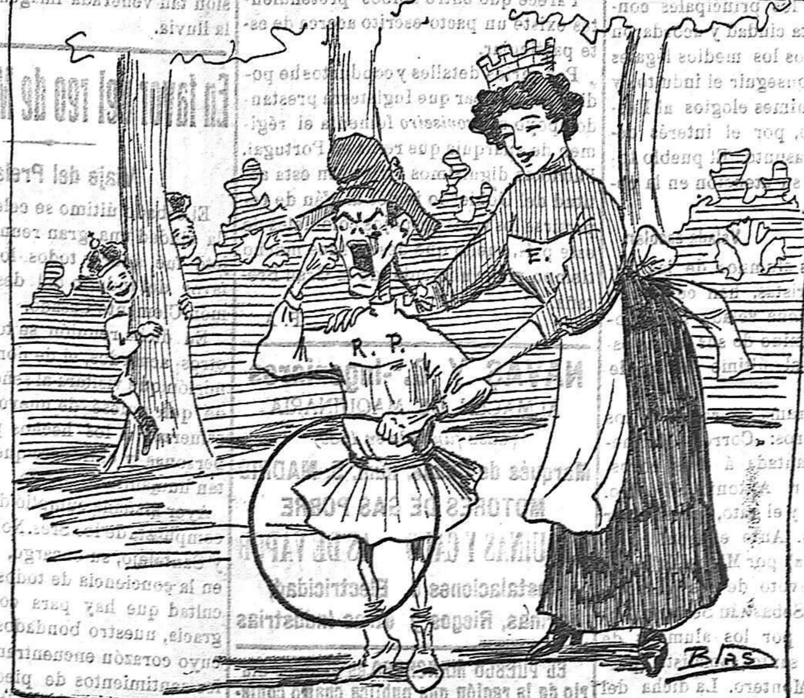
LA NIÑA.—¡Ay! ¡ay! No me dejes sola chacha que esos niños me asustan mucho.