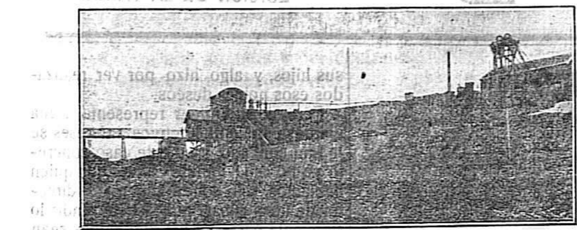
Mina «San Francisco», de la cuenca de Puertollano.

te a la actitud del Trabajo, dimos por terminada nuestra entrevista. Y otra vez cruzamos junto a los pozos de las minas desiertas, que a la manera de las bocas de unos cuantos monstruos, sin vida, se nos ofrecían silenciosas.