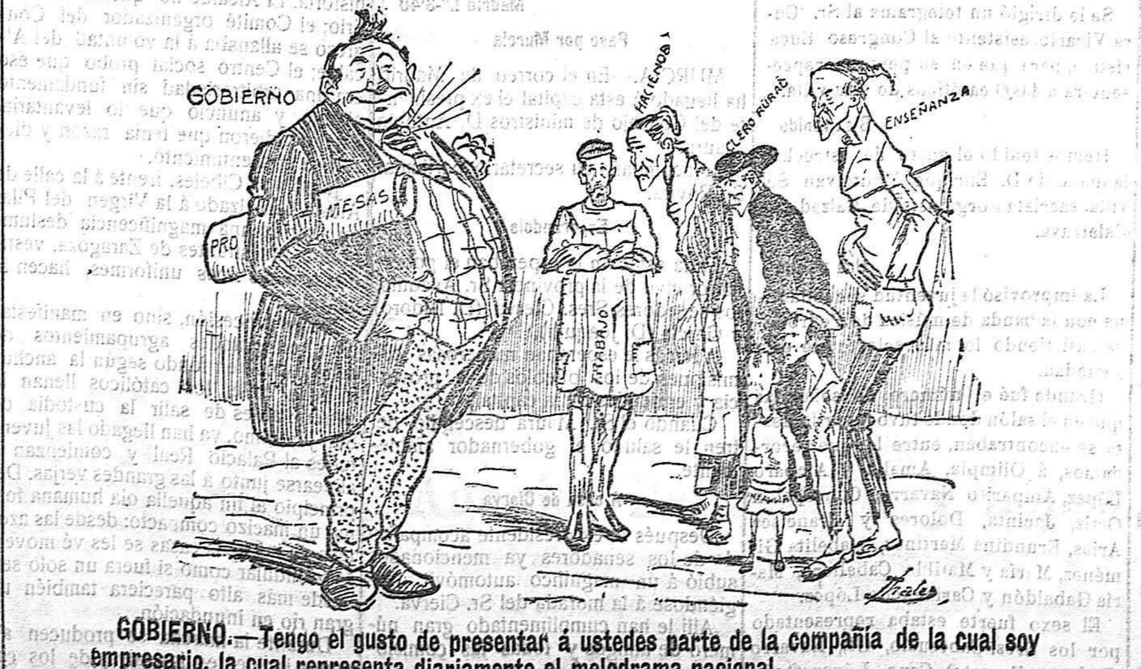
GOBIERNO.—Tengo el gusto de presentar á ustedes parte de la compañía de la cual soy empresario, la cual representa diariamente el melodrama nacional.