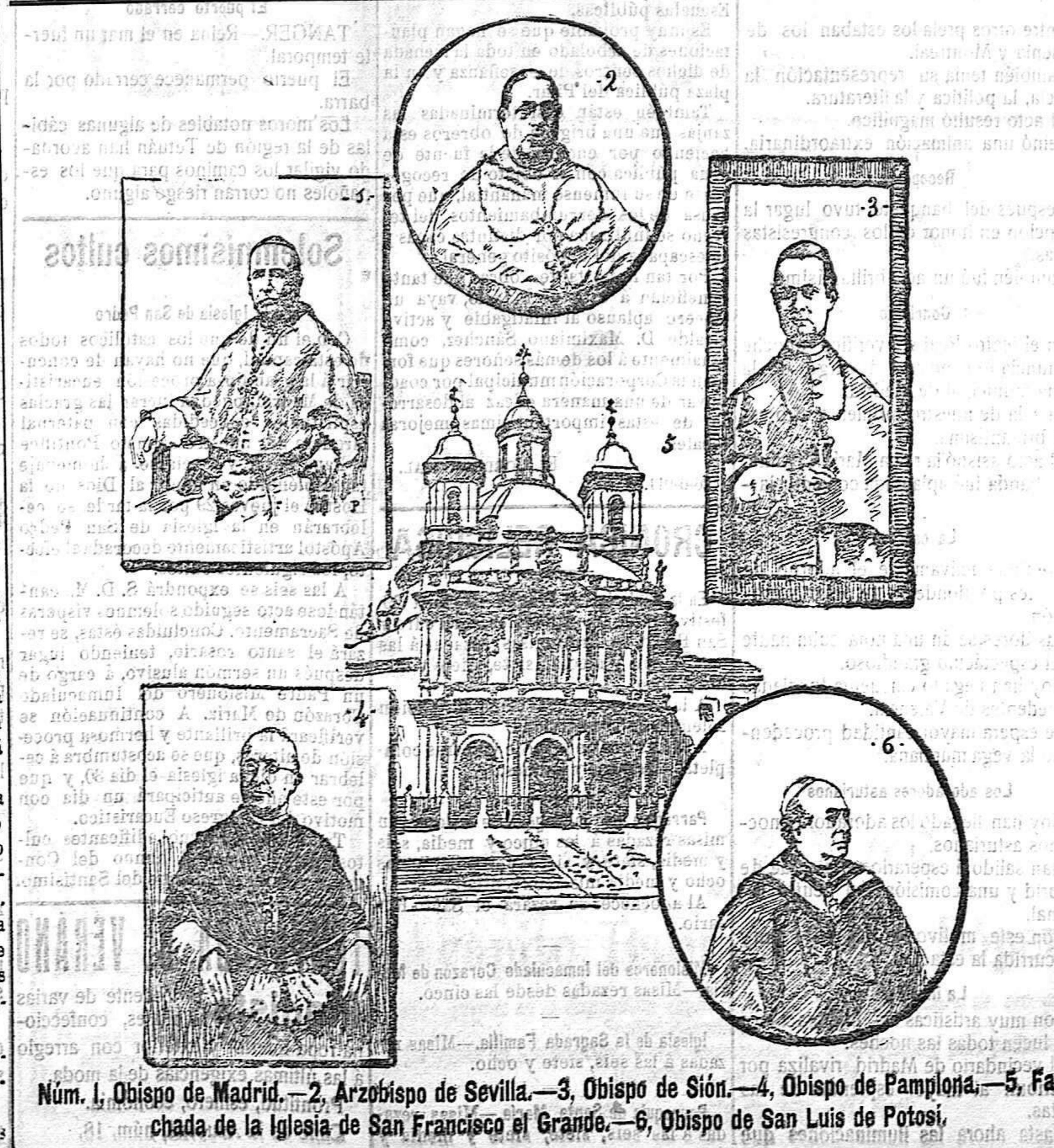
Num. 1, Obispo de Madrid.—2, Arzobispo de Sevilla.—3, Obispo de Sión.—4, Obispo de Pamplona.—5, Fachada de la Iglesia de San Francisco el Grande.—6, Obispo de San Luis de Potosí.

II La misa San Gregorio, de Habert.—La sesión inaugural del Congreso En la misa de pontifical, celebrada el domingo en la cripta de la Almudena, se interpretó una obra de una entonación reposada y serena la misa San Gregorio , á cuatro voces, orquesta y órgano, de Habert. En esta obra vigorosa y rejuvenecedora el autor formas caducas y abandonadas.