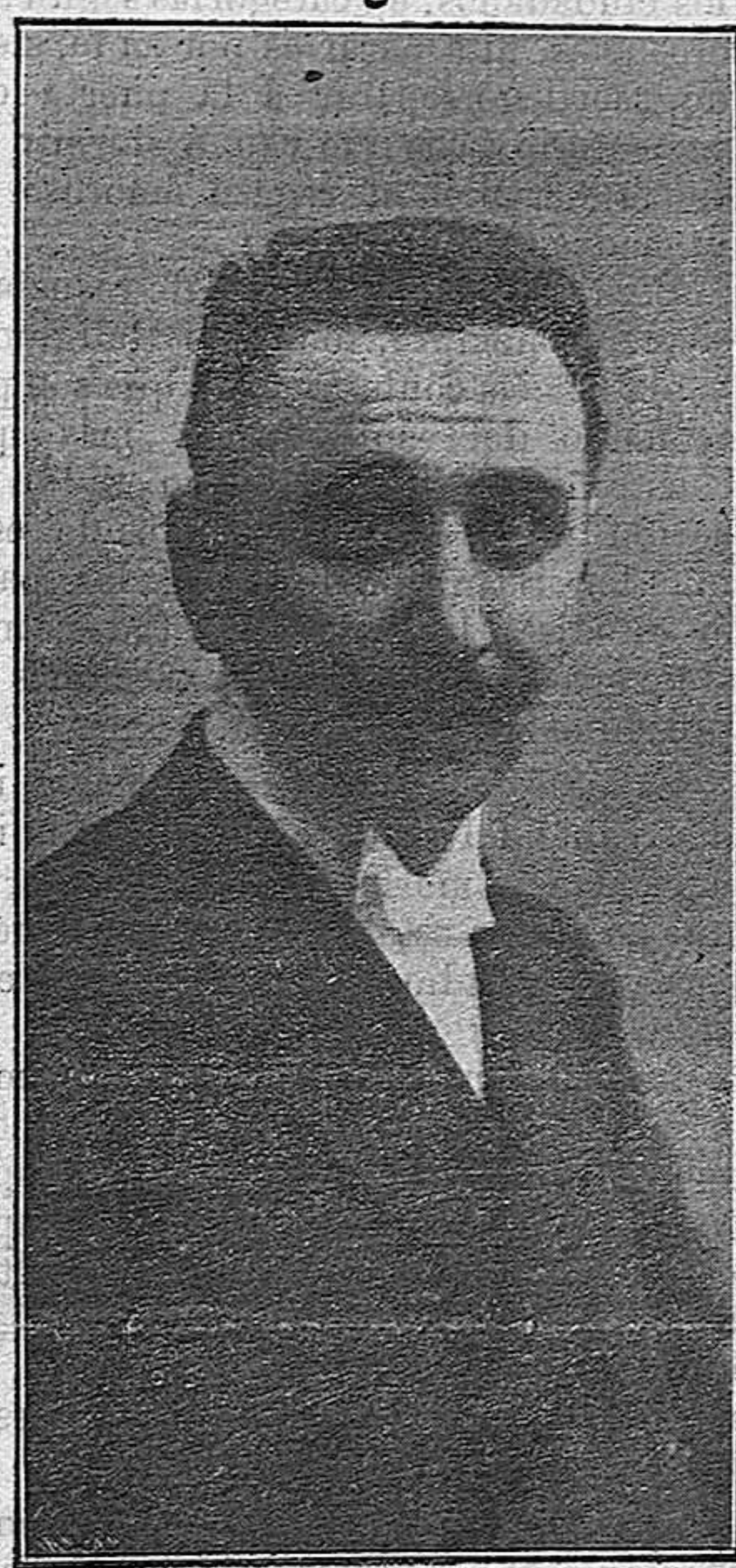
D. Melquiades Alvarez