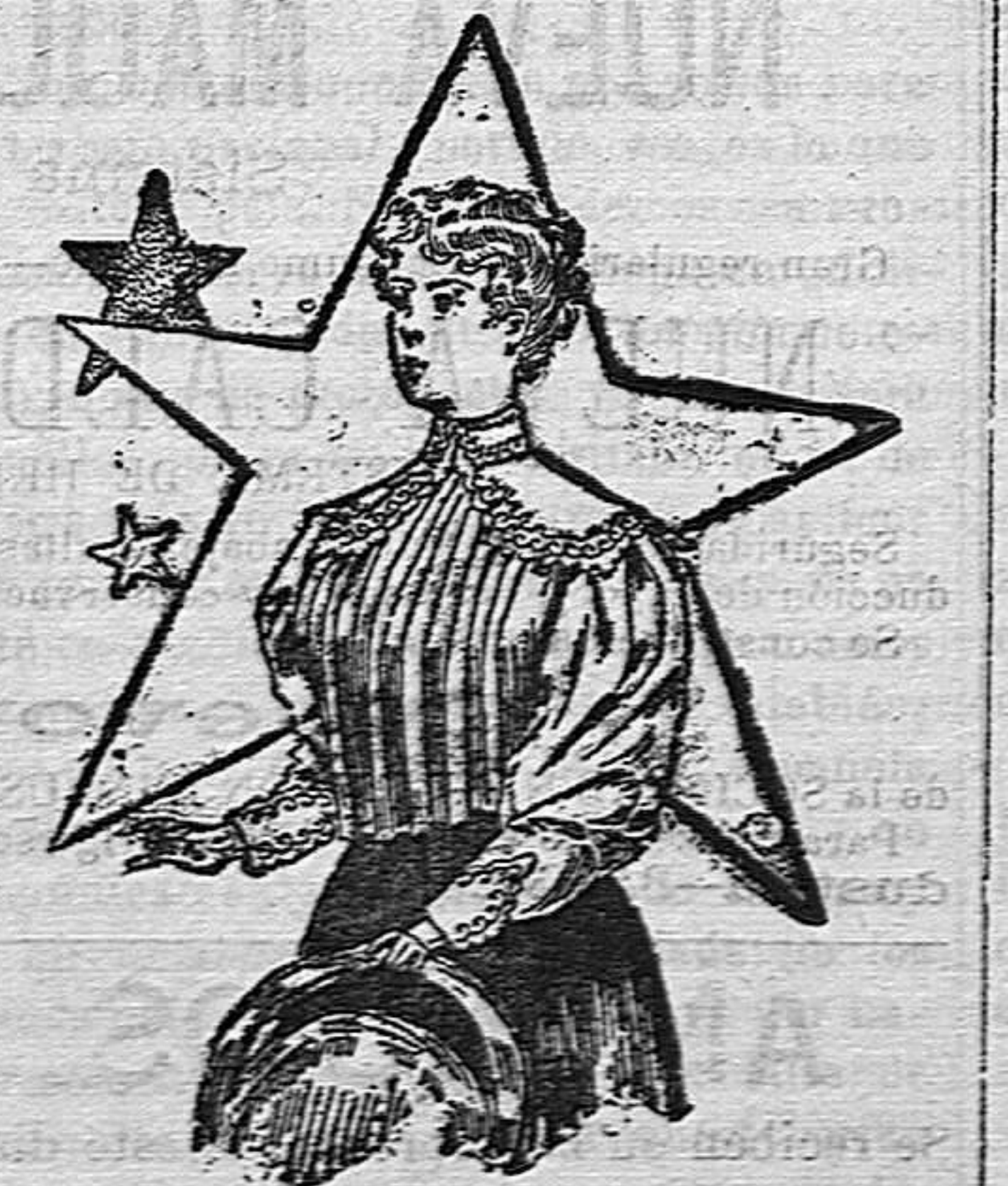
BLUSA DE FRANELA.—La espalda es larga

Si este sombrero se confecciona en casa, pueden agruparse los adornos en la forma que se desee, contando siempre con el buen gusto de la encargada de este trabajo. Si por falta de práctica no se encontrara el modo de repartir estos adornos de modo que el sombrero resultase airoso, puede tomarse por guía el modelo que ofrecemos en nuestro grabado letra. Difícilmente se encontrará un modo más sencillo y elegante de adornar este sombrero muy apropiado para niñas que no pasen de doce años.