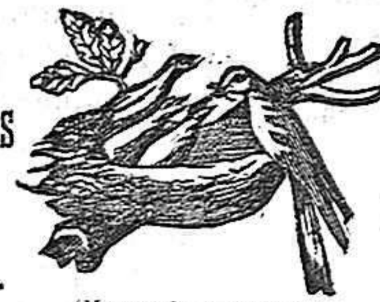
(Marca de garantía.)