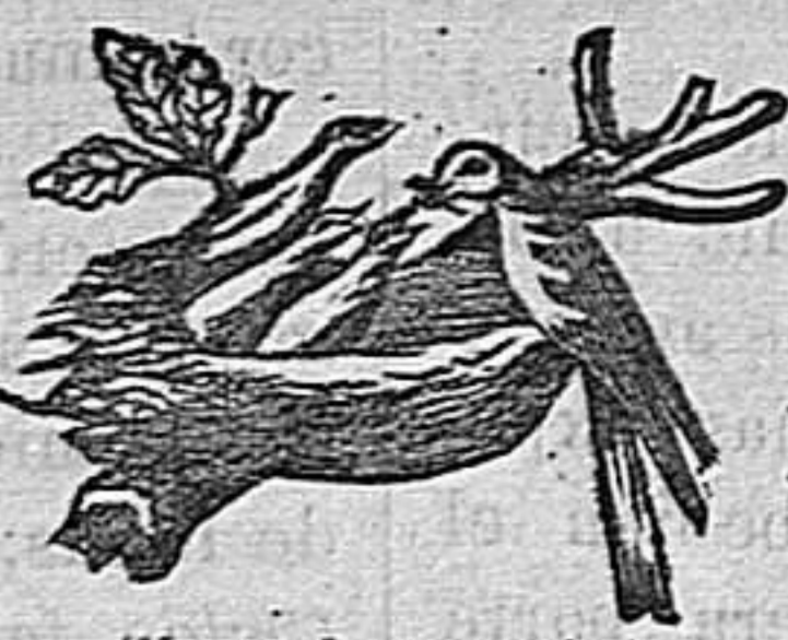
(Marca de garantía.)