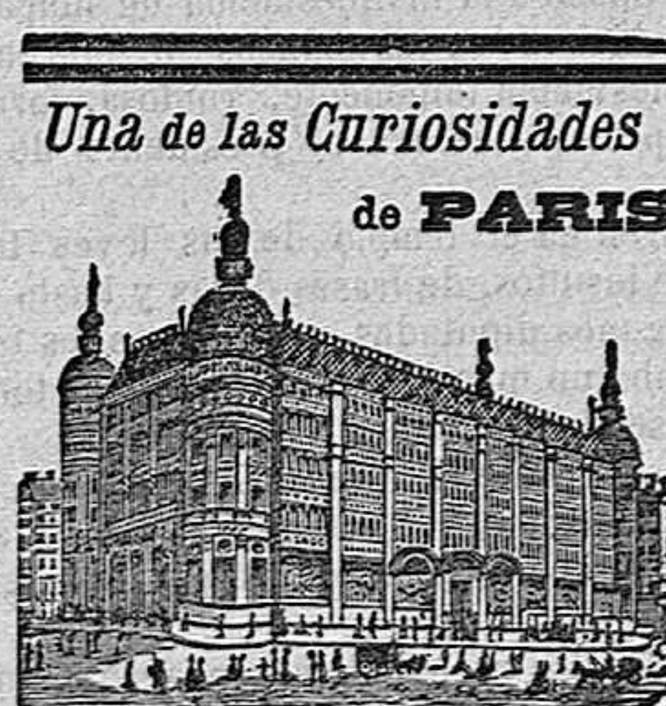
GRANDES ALMACENES DEL

En el último año se han vendido más de dos millones de purgas.