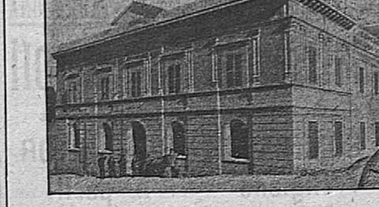
Colegio provincial TARRAGONA

MALALTIAS DE LA PELL Y MALALTIAS CRÒNICAS CONSULTA DE 11 A 1 TARRAGONA.—COMTE DE RIUS, 20. 2.º—TARRAGONA