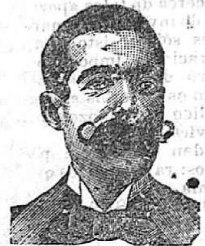
A. Sant Costanzi Diputado, 435, Barcelona

PROCURADOR.—San Francisco, 22, 1.º 2.º.—TARRAGONA