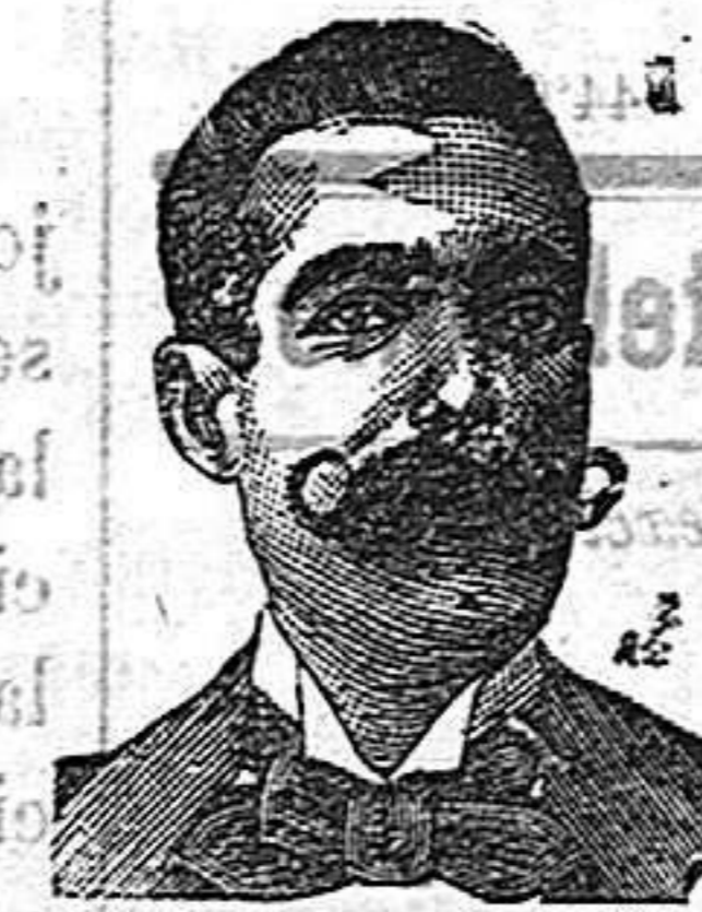
A. Sazati Cosanzí Diputación, 435, Barcelona

INYECCION ANTIVENÉREO Y ROOB ANTISIFILITICO—COSTANZI