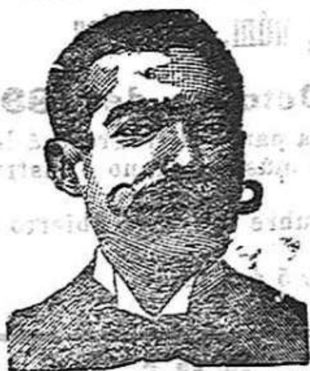
A. Salvati Costanzi Diputación, 435, Barcelona.

Ó INYECCIÓN ANTIVENÉREA — Y ROOB ANTISIFILÍTICO — COSTANZI