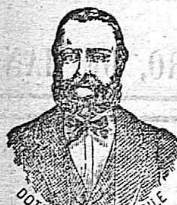
Inventor de los renombrados medicamentos CASILE.