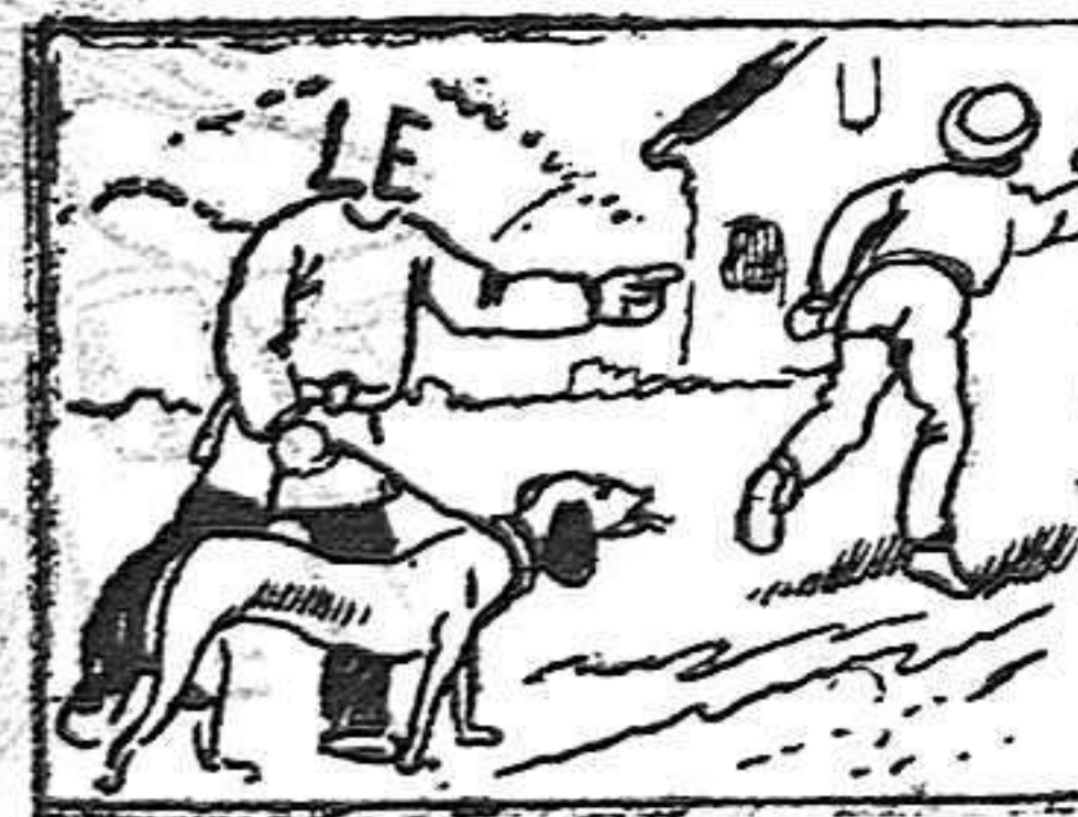
La solución en el próximo número.

Solución á la Charada en acción anterior