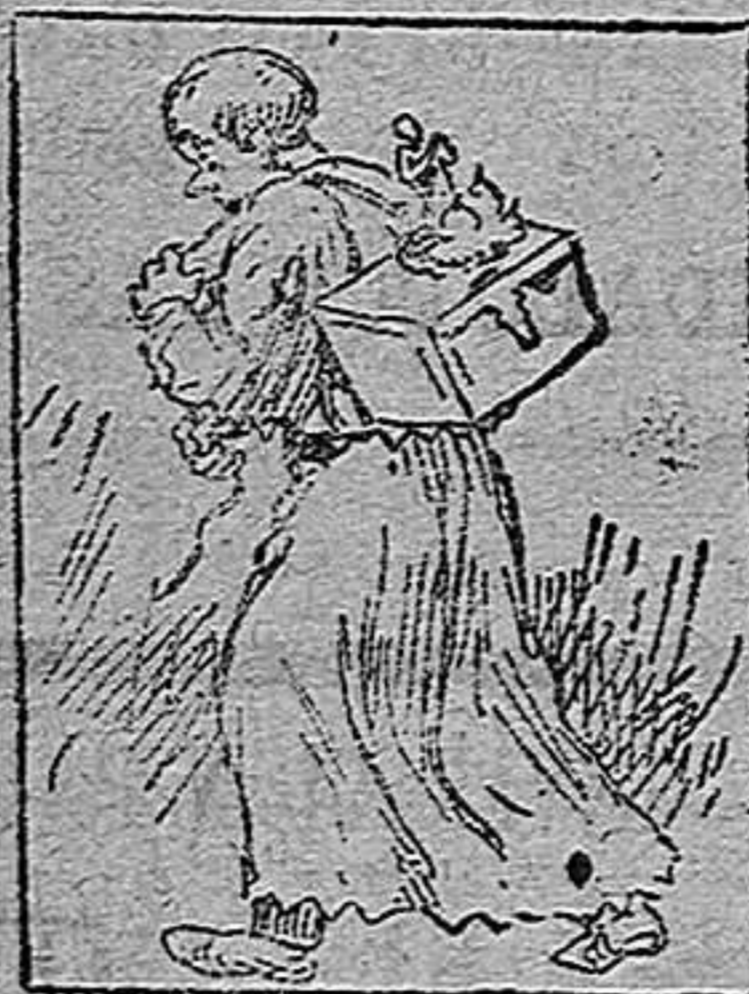
La solución en el próximo número.