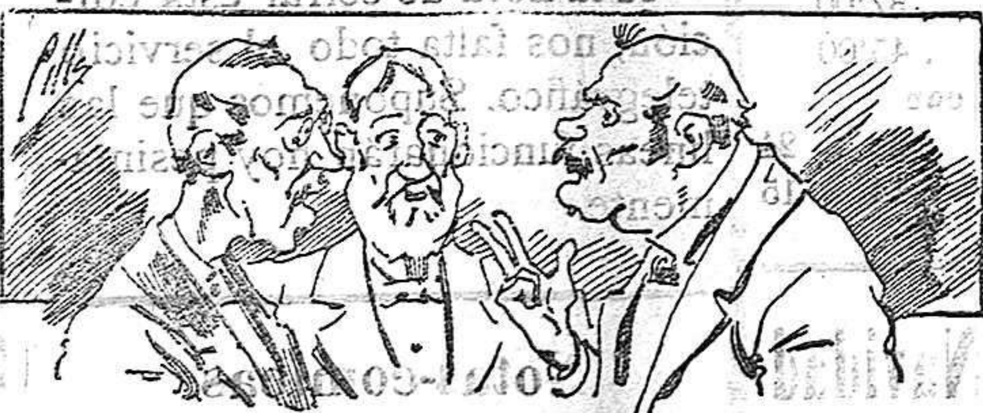
Abominan á nuestros libros....., pero los compran.

Todas las personas de gusto, curiosas é ilustradas deben pedir al Director de LA AVISPA, apartado núm. 8, MADRID, un ejemplar que se remite gratis y franqueado. Esta Revista Enciclopédica Popular publica recreaciones científicas, recetas de cocina, repostería, confitería, vinos, licores, pinturas, barnices, betunes y fórmulas para toda clase de industria, y cuantas noticias y conocimientos puedan ser beneficiosos. Cuenta además con buenos grabados, parte literaria excelente; da regalos mensuales á sus lectores con la Lotería Nacional y participaciones en la misma, á cuyo efecto compra todos los sorteos, y en una de las Administraciones más afortunadas por la suerte, billetes enteros. La suscripción y los números que se nos pidan se sirven gratuitamente á correo vuelto y franqueados, con sólo indicar el nombre y dirección del que lo desea en sobre dirigido al Sr. Administrador de