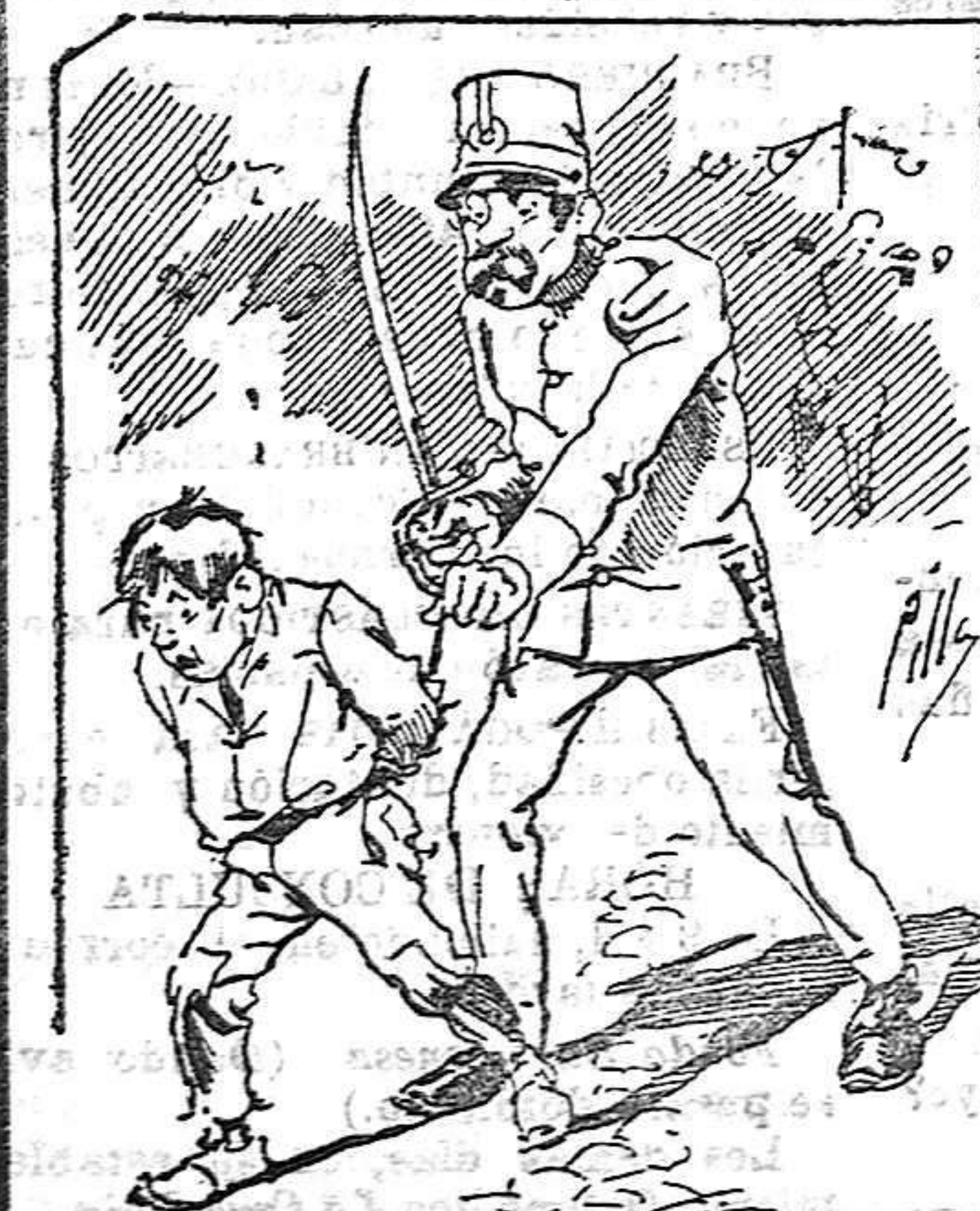
Tratamientos de la policía á nuestros vendedores cuando el número pica.....