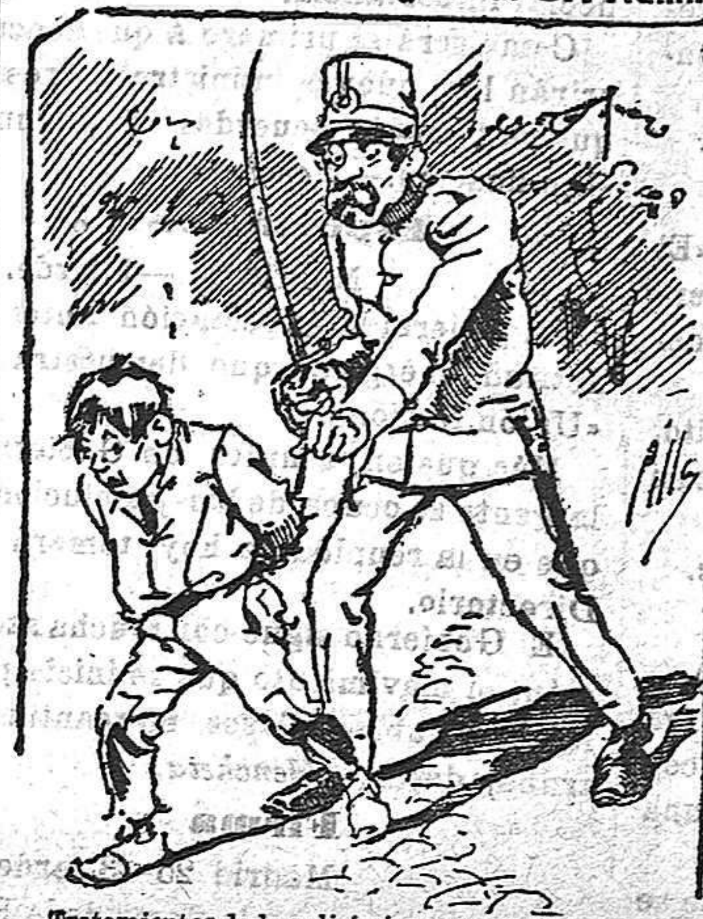
Tratamientos de la policía a nuestros vendedores cuando el número pica...