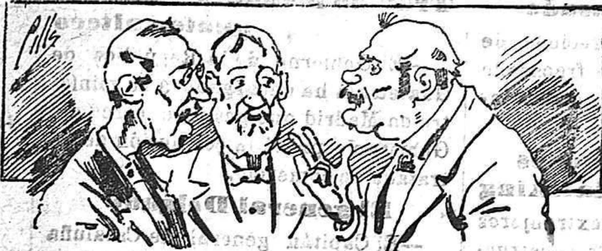
Abominan a nuestros libros... pero los compran.

Todas las personas de gusto, curiosas e ilustradas deben pedir al Director de LA AVISPA, apartado núm. 8, MADRID, un ejemplar que se remite gratis y franqueado. Esta Revista Enciclopédica Popular publica recreaciones científicas, recetas de cocina, repostería, confitería, vinos, licores, pinturas, barnices, betunes y fórmulas para toda clase de industria, y cuantas noticias y conocimientos puedan ser beneficiosos. Cuenta además con buenos grabados, parte literaria excelente; da regalos mensuales a sus lectores con la Lotería Nacional y participaciones en la misma, a cuyo efecto compra todos los sorteos, y en una de las Administraciones más afortunadas por la suerte, billetes enteros. La suscripción y los números que se nos pidan se sirven gratuitamente a correo vuelto y franqueados, con sólo indicar el nombre y dirección del que lo desea en sobre dirigido al Sr. Administrador de