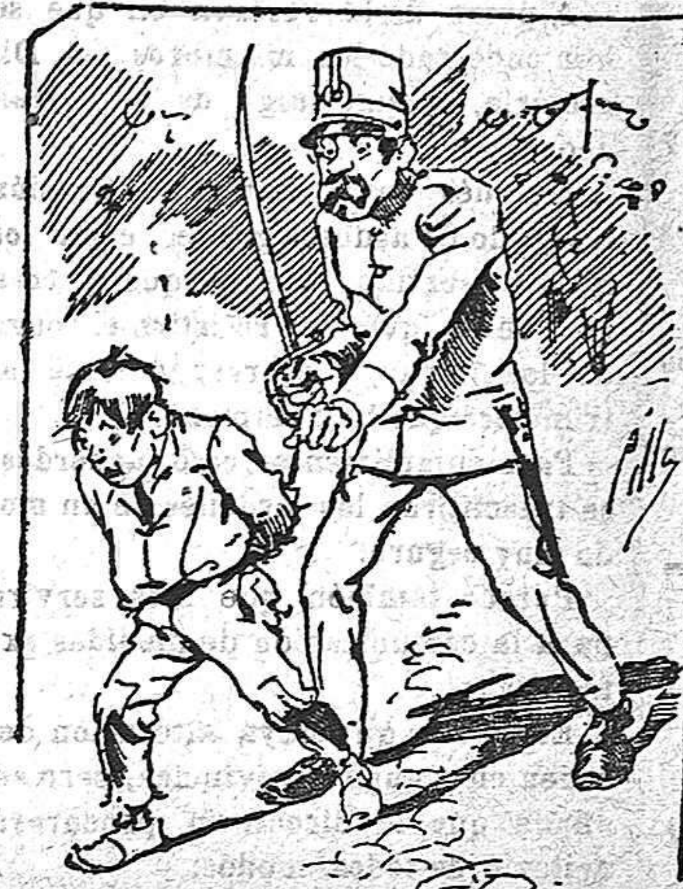
Tratamientos de la policía a nuestros vendedores cuando el número pica...