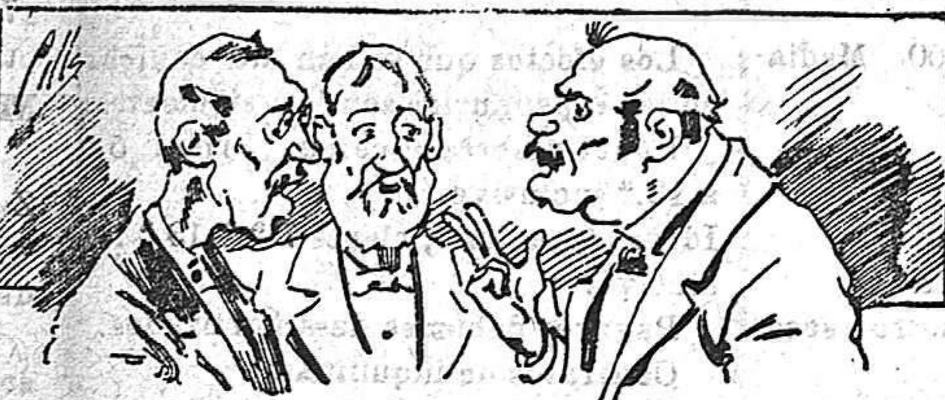
Abominan a nuestros libros..... pero los compran.

Todas las personas de gusto, curiosas e ilustradas deben pedir al Director de LA AVISPA, apartado núm. 8, MADRID, un ejemplar que se remite gratis y franqueado. Esta Revista Enciclopédica Popular publica recreaciones científicas, recetas de cocina, repostería, confitería, vinos, licores, pinturas, barnices, betunes y fórmulas para toda clase de industria, y cuantas noticias y conocimientos puedan ser beneficiosos. Cuenta además con buenos grabados, parte literaria excelente; da regalos mensuales a sus lectores con la Lotería Nacional y participaciones en la misma, a cuyo efecto compra todos los sorteos, y en una de las Administraciones más afortunadas por la suerte, billetes enteros. La suscripción y los números que se nos pidan se sirven gratuitamente a correo vuelto y franqueados, con sólo indicar el nombre y dirección del que lo desea en sobre dirigido al Sr. Administrador de