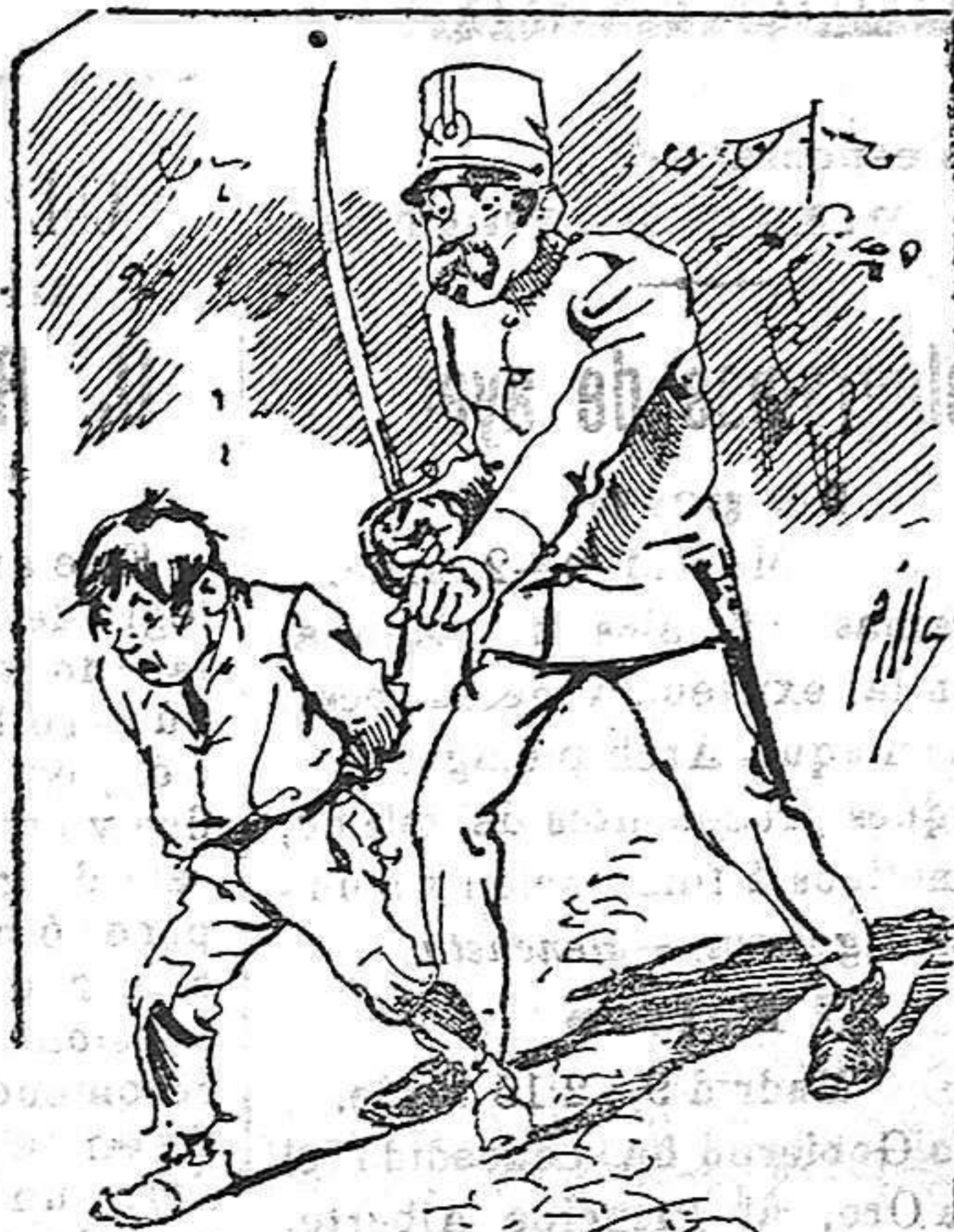
Tratamientos de la policía á nuestros vendedores cuando el número pica.....