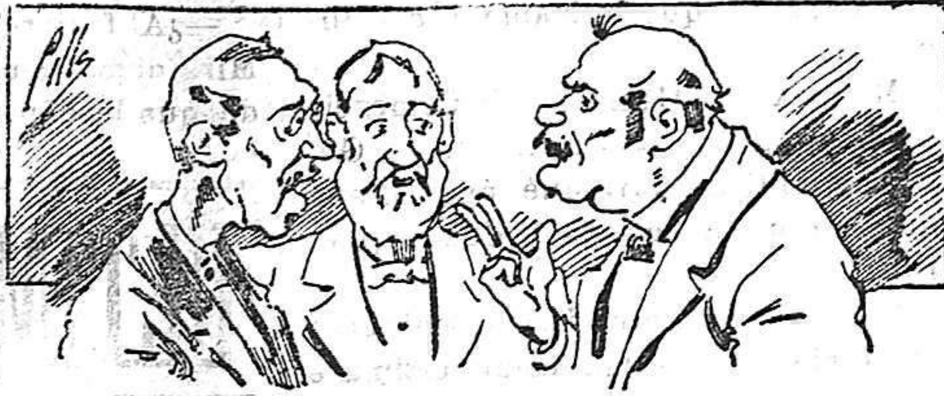
Abominan á nuestros libros....., pero los compran.

Todas las personas de gusto, curiosas é ilustradas deben pedir al Director de LA AVISPA, apartado núm. 8, MADRID, un ejemplar que se remite gratis y franqueado. Esta Revista Enciclopédica Popular publica recreaciones científicas, recetas de cocina, repostería, confitería, vinos, licores, pinturas, barnices, betunes y fórmulas para toda clase de industria, y cuantas noticias y conocimientos puedan ser beneficiosos. Cuenta además con buenos grabados, parte literaria excelente; da regalos mensuales á sus lectores con la Lotería Nacional y participaciones en la misma, á cuyo efecto compra todos los sorteos, y en una de las Administraciones más afortunadas por la suerte, billetes enteros. La suscripción y los números que se nos pidan se sirven gratuitamente á correo vuelto y franqueados, con sólo indicar el nombre y dirección del que lo desea en sobre dirigido al Sr. Administrador de