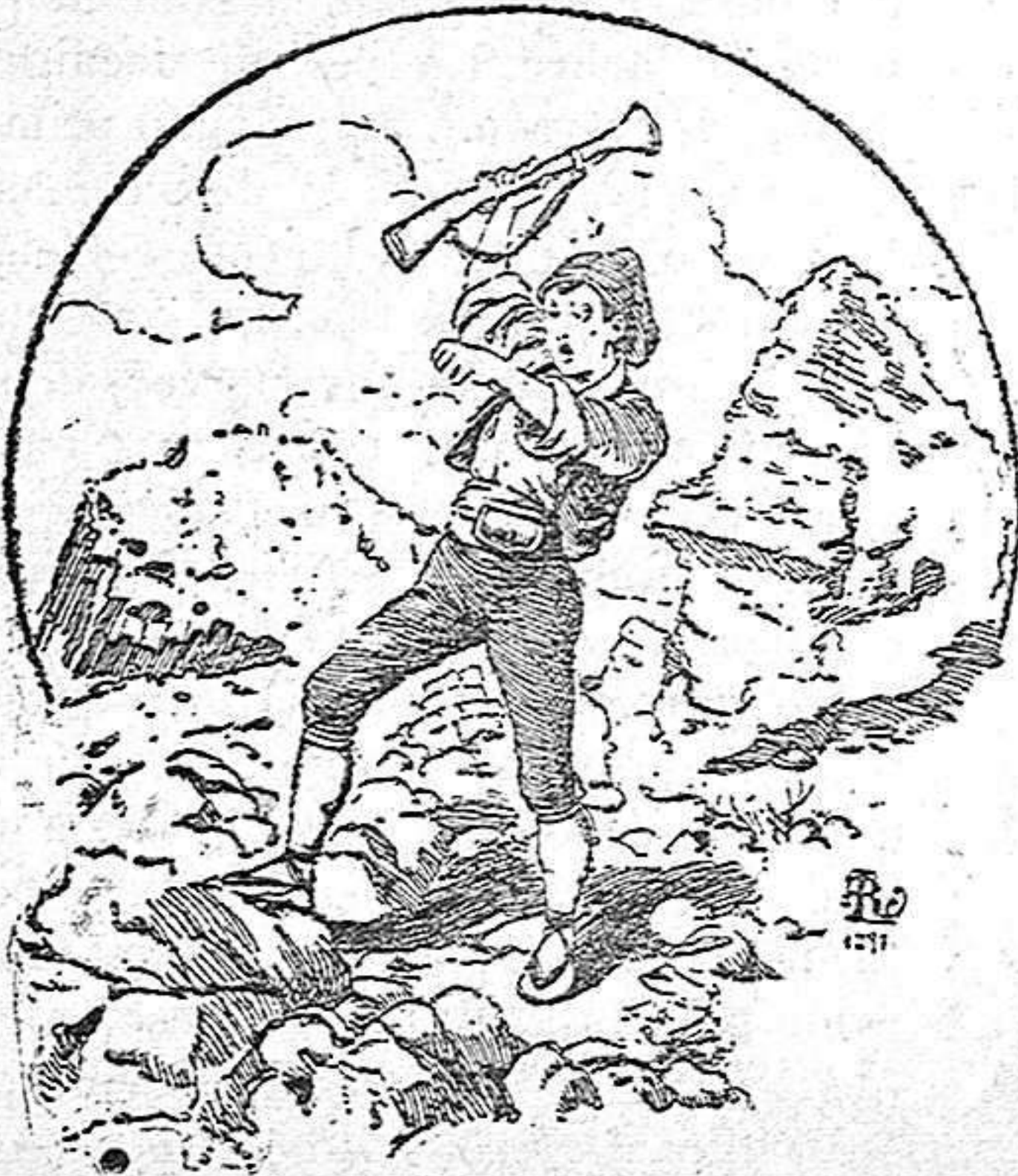
LO DEFENSOR DE GIRONA (1)