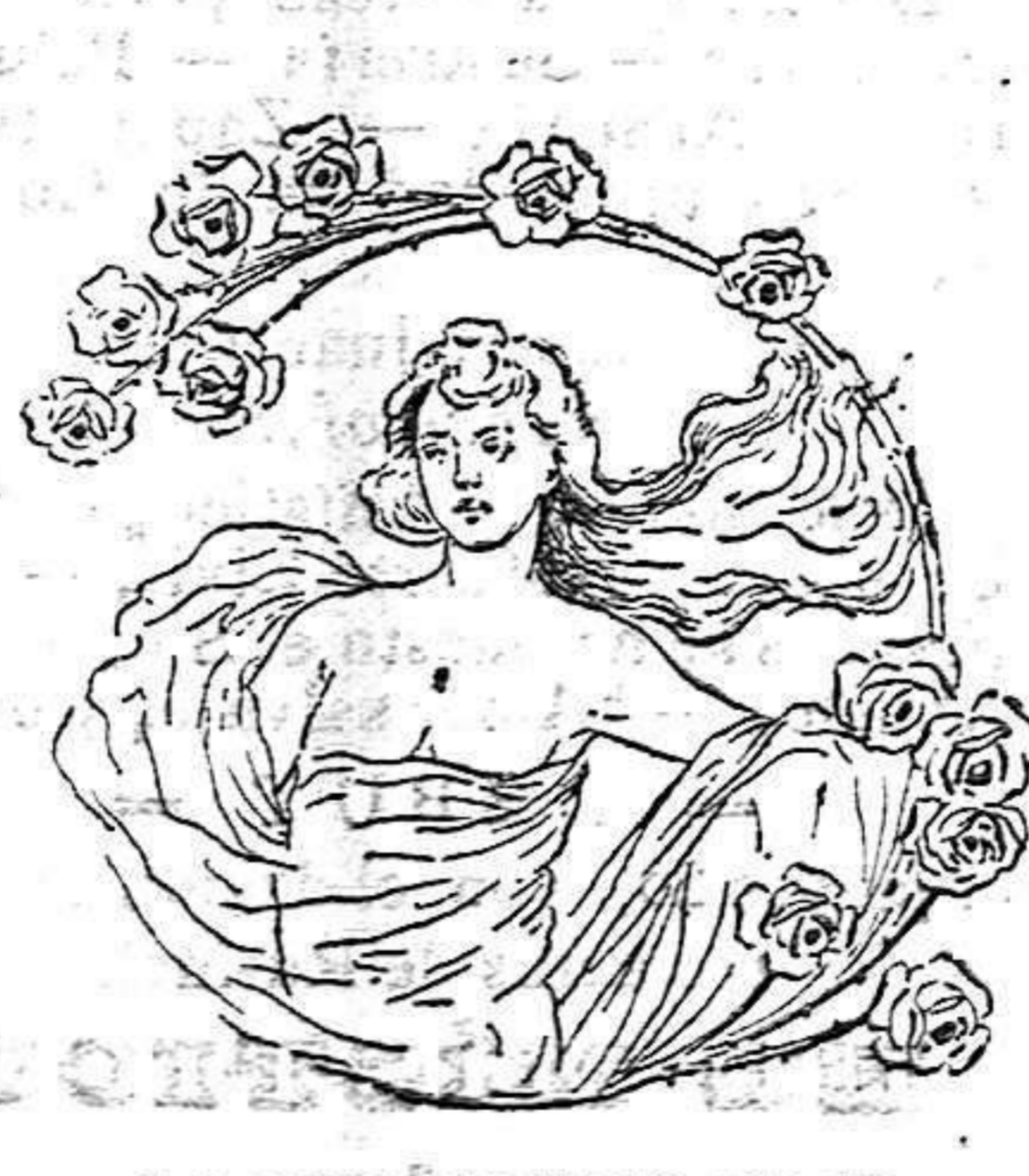
LA QUE NO HIZO CASO