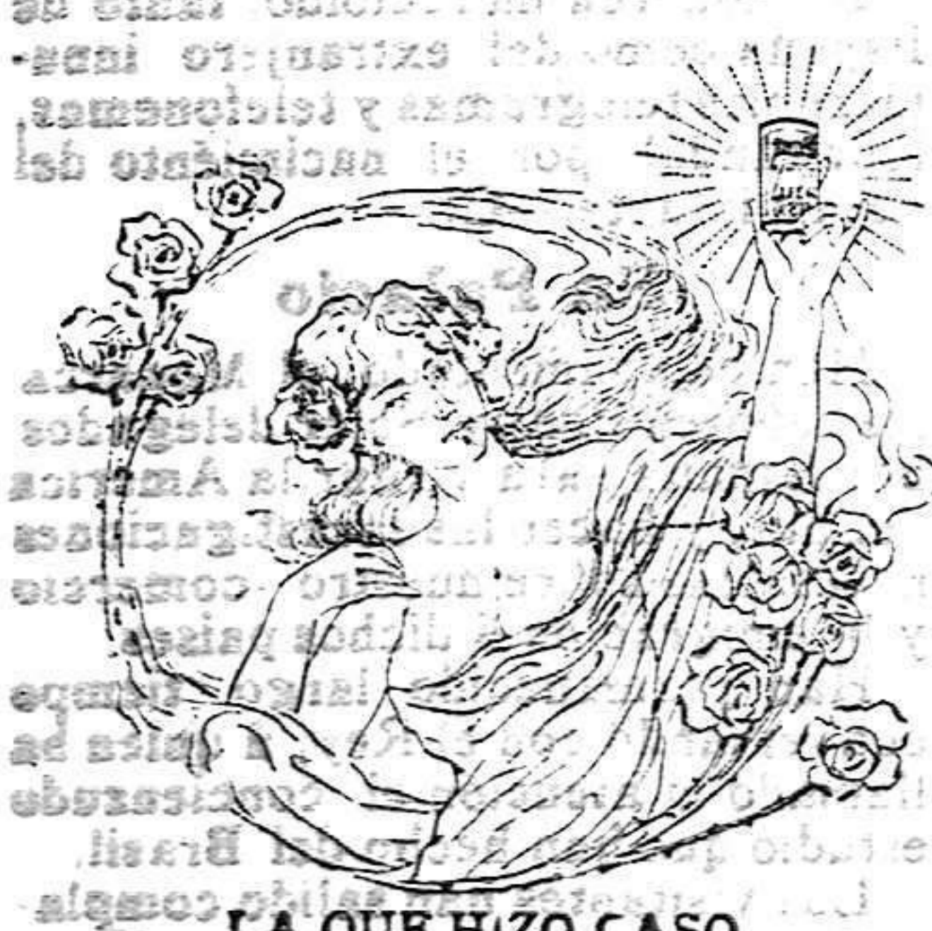
LA QUE HIZO CASO

Al entrar en el 8.º mes del embarazo, todas las mañanas se hará con una bayeta, un baño á los pechos con agua salada á saturación y á placer. Por espacio de 5 minutos, y enjugándolos después con una tohalla. Se pondrá un gramo de polvos al pulpejo de la mano y se restregarán por toda la parte esponjosa y delantera de los pechos, hasta conseguir emocionarlos en los poros del cutis, poniendo encima la misma bayeta de dos dobles ligeramente mójada con la misma agua á placer y se abrochará el corsé.