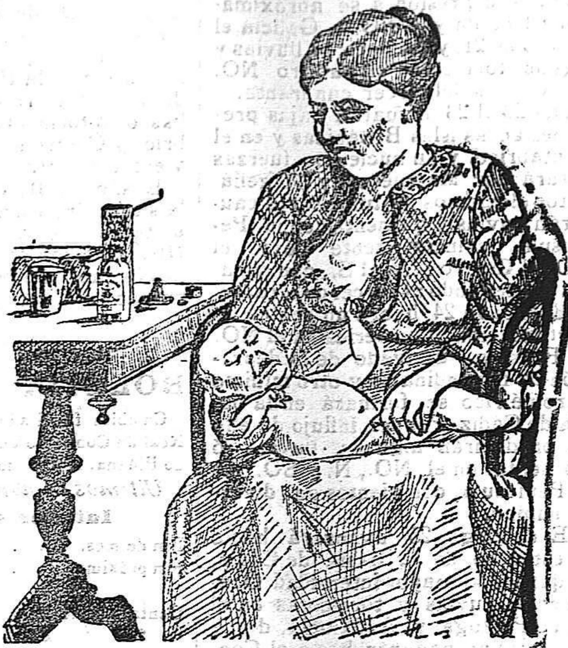
La que no hizo caso del Salverol