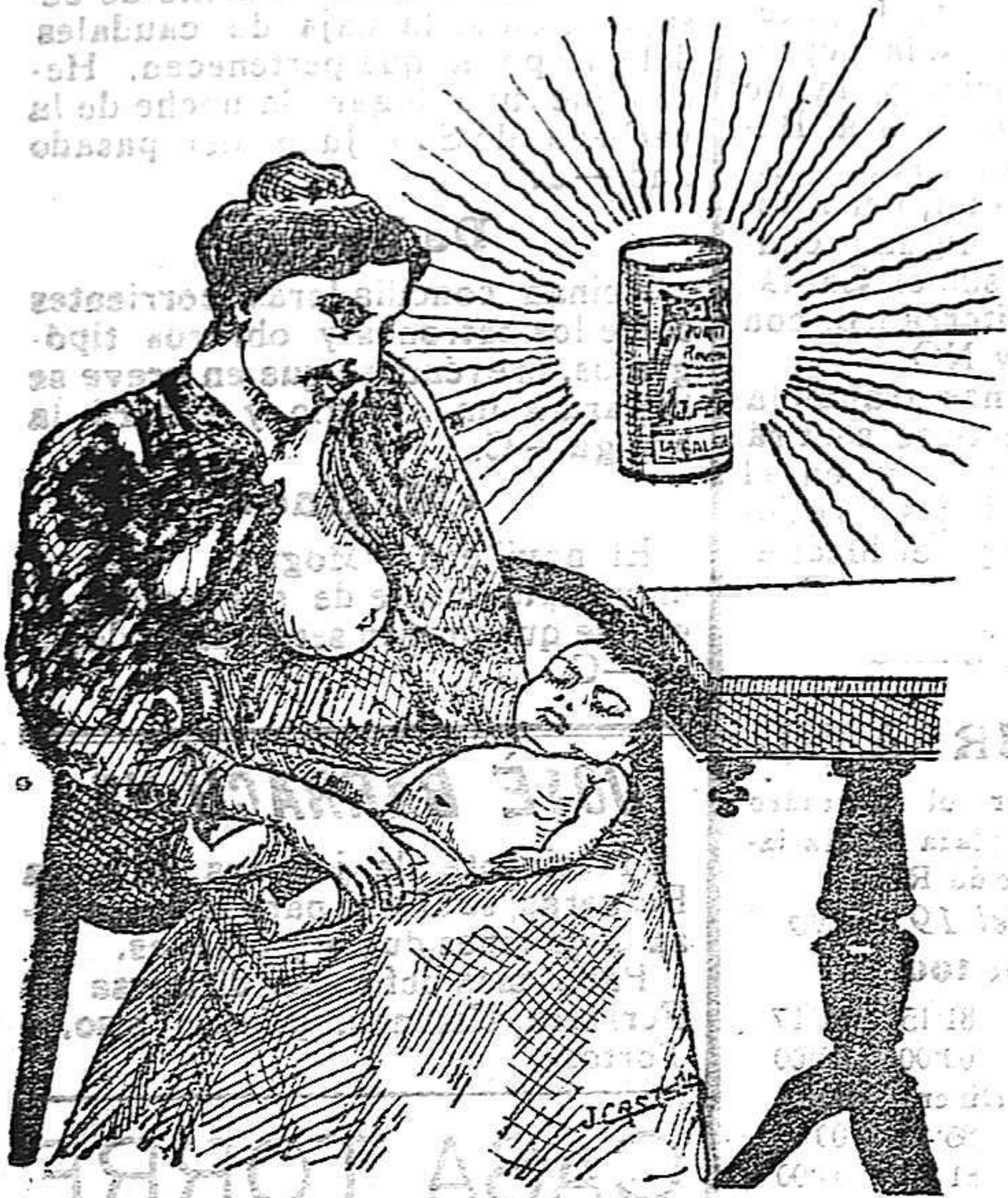
La que hizo caso del Salverol

Depósito general S. A. del Salverol en Santa Bárbara (Tarragona)