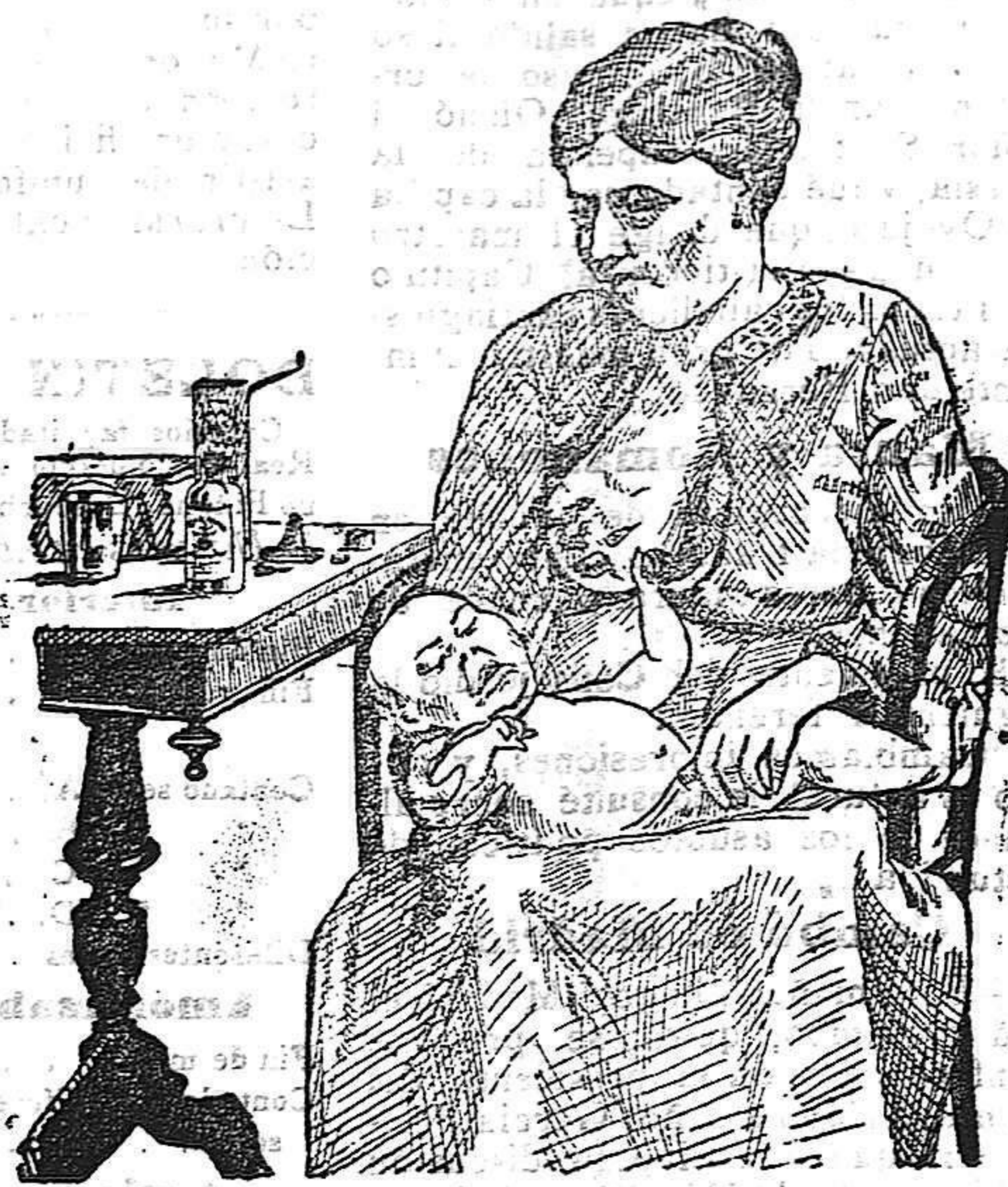
La que no hizo caso del Salverol