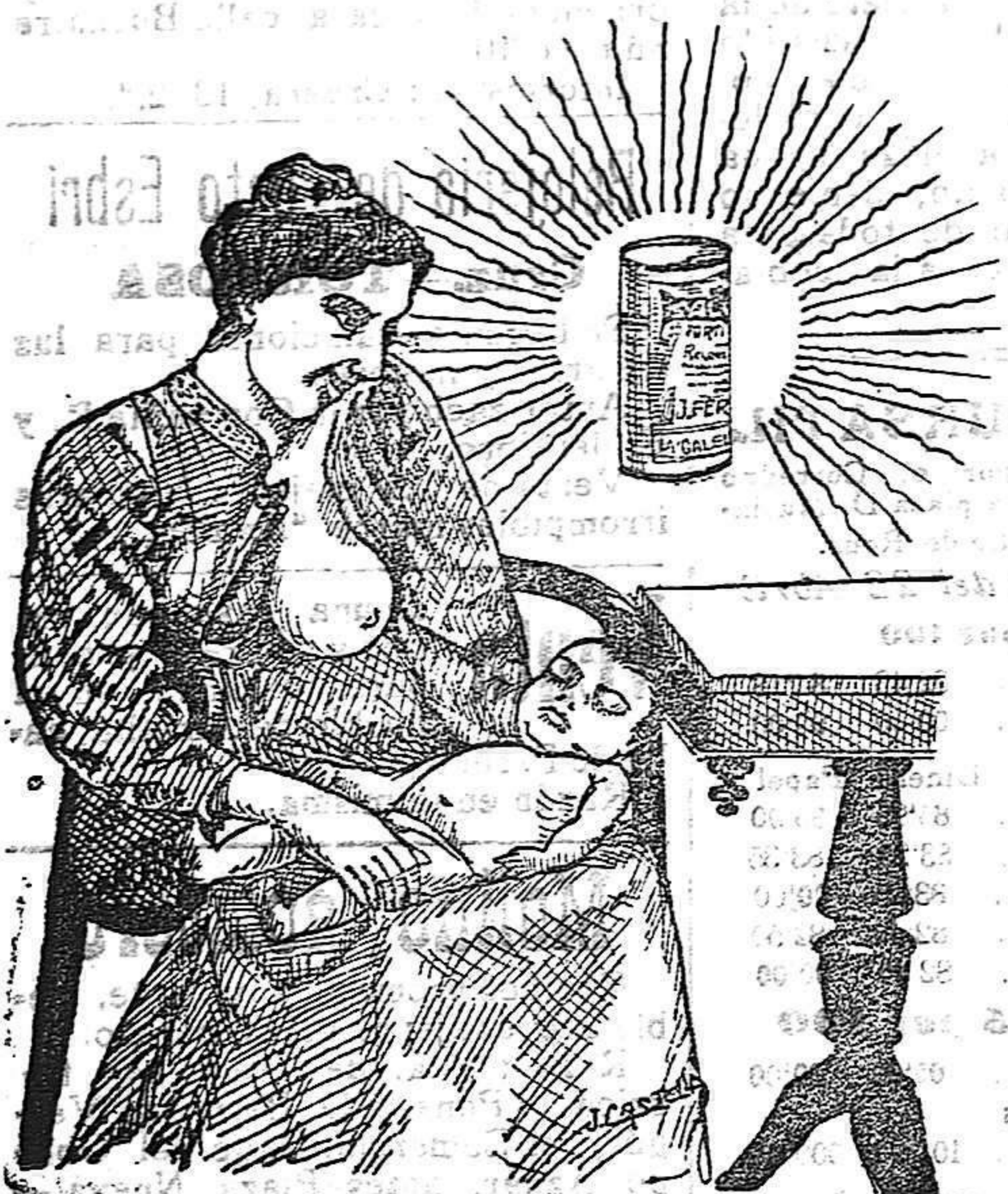
La que hizo caso del Salverol

Depósito general S. A. del Salverol en Santa Bárbara (Tarragona)