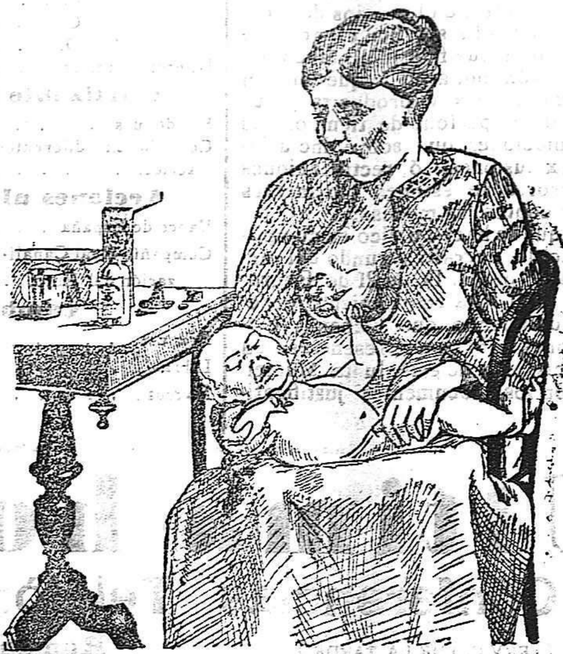
La que no hizo caso del Salverol