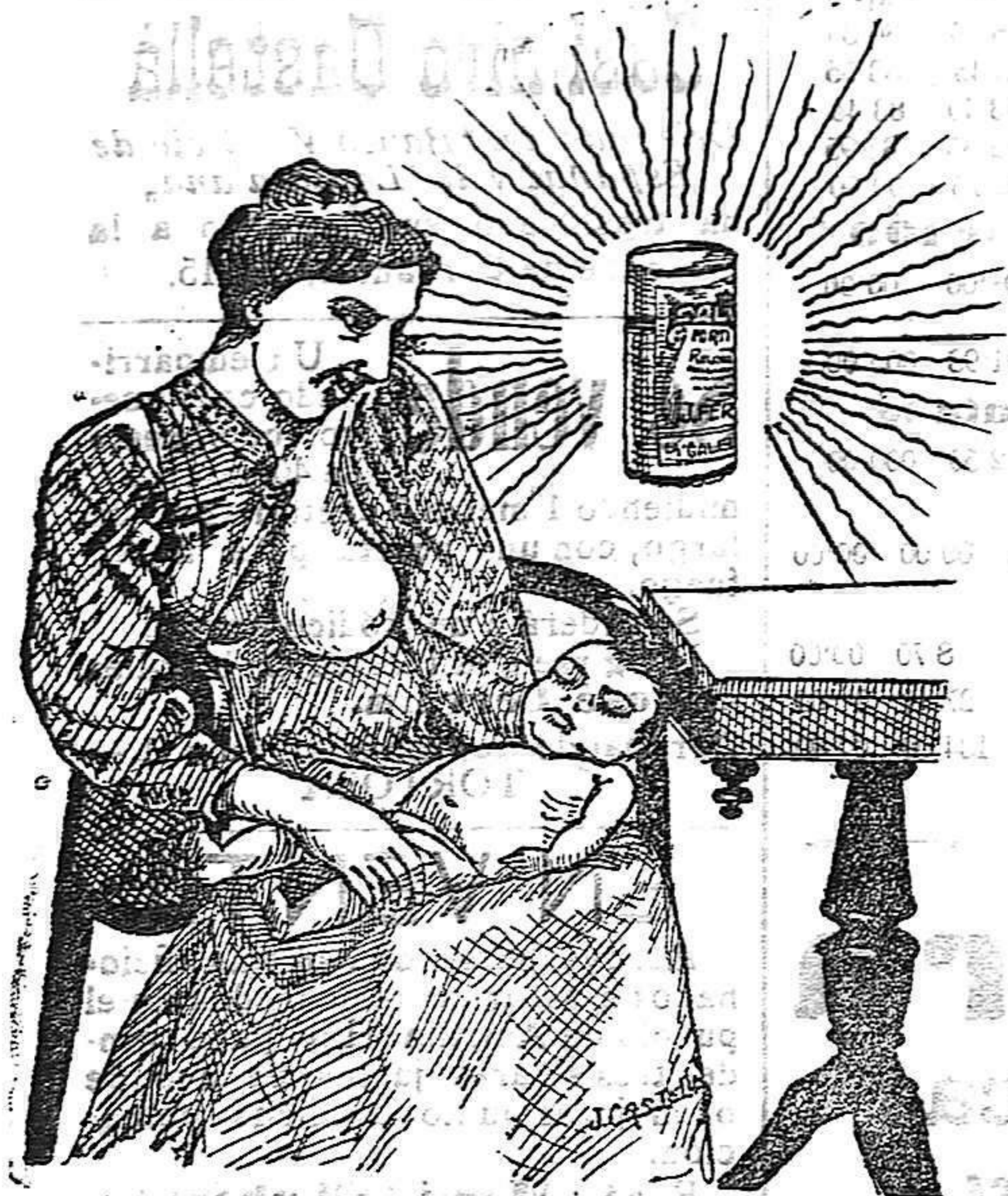
La que hizo caso del Salverol

Depósito general S. A. del Salverol en Santa Bárbara (Tarragona)