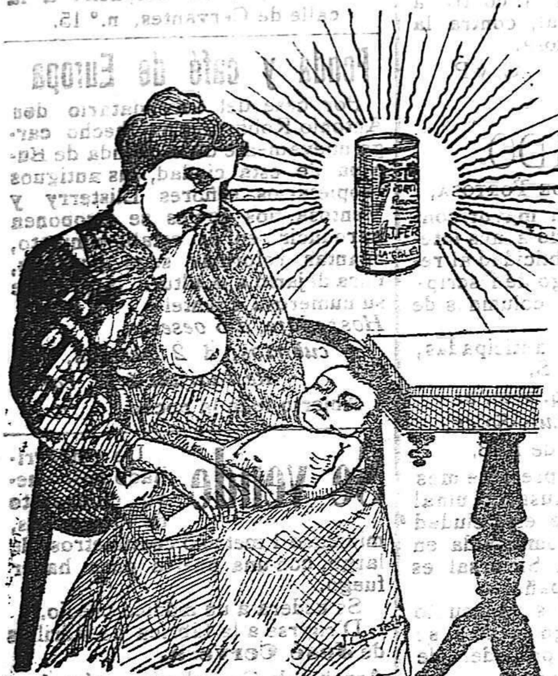
La que hizo caso del Salverol

Depósito general S. A. del Salverol en Santa Bárbara (Tarragona)