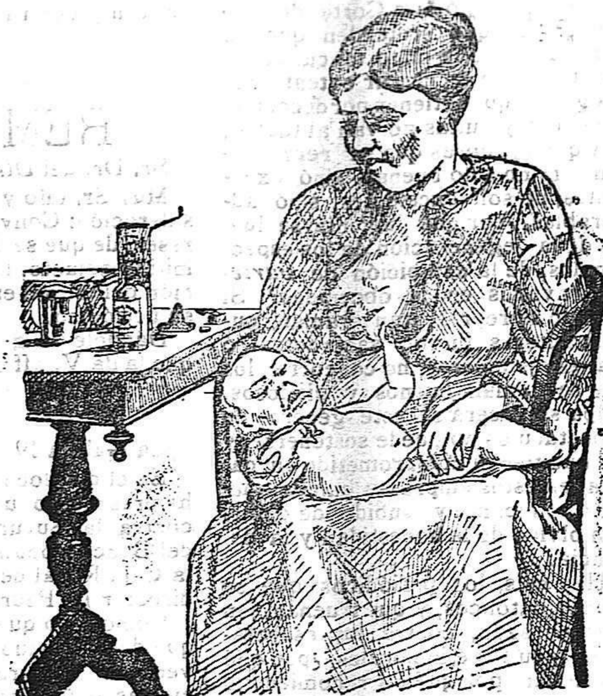
La que no hizo caso del Salverol