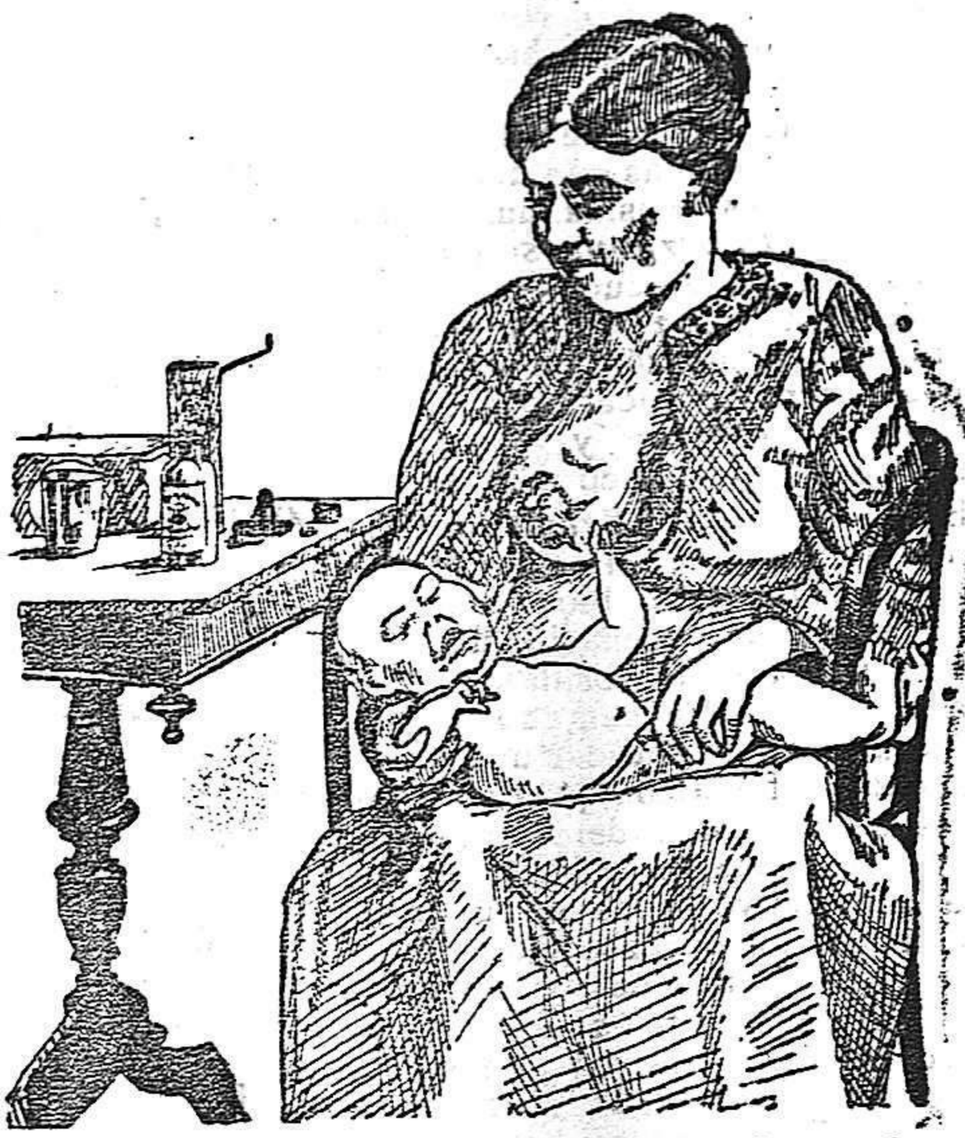
La que no hizo caso del Salverol