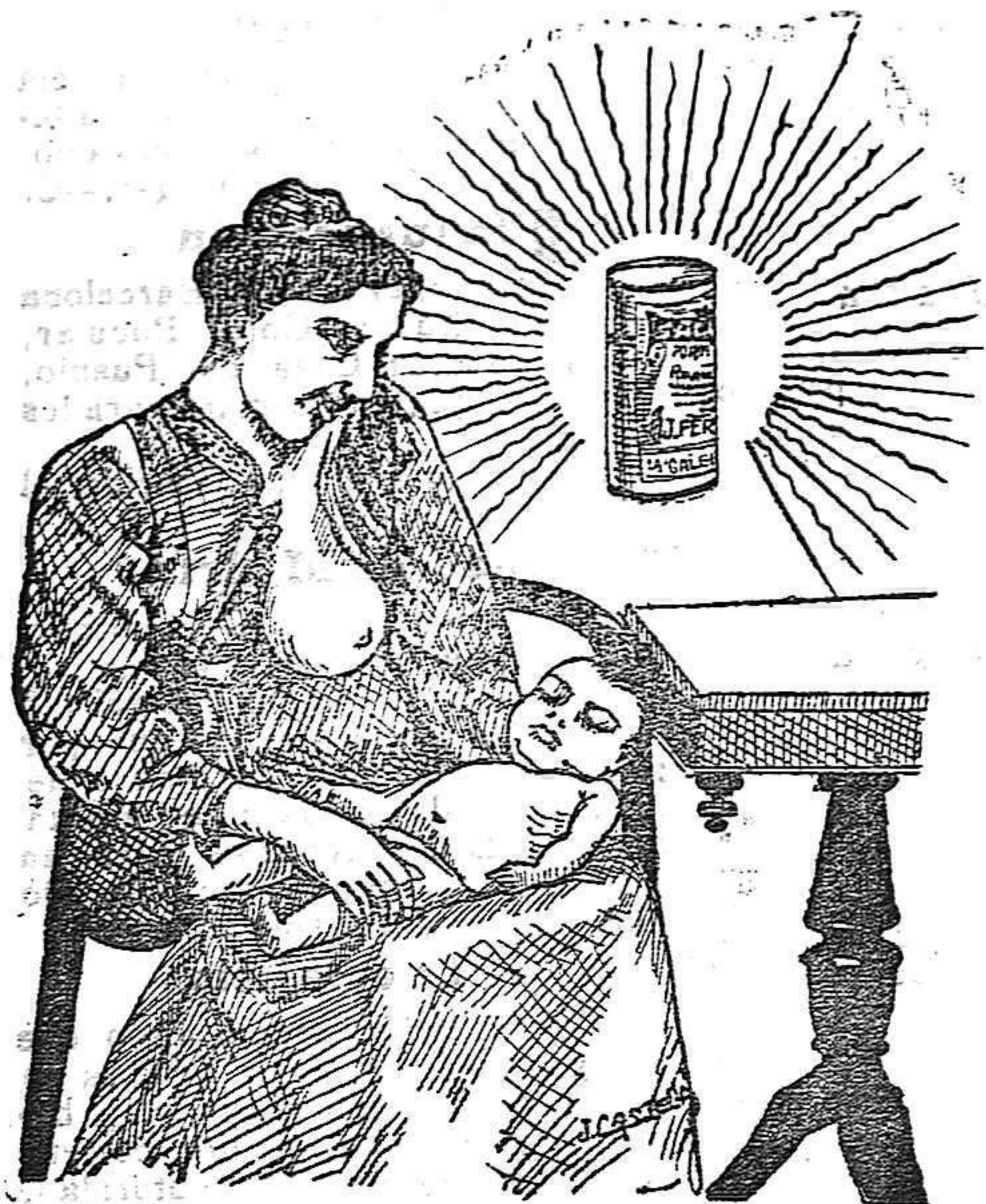
La que hizo caso del Salverol

Depósito general S. A. del Salverol en Santa Bárbara (Tarragona)