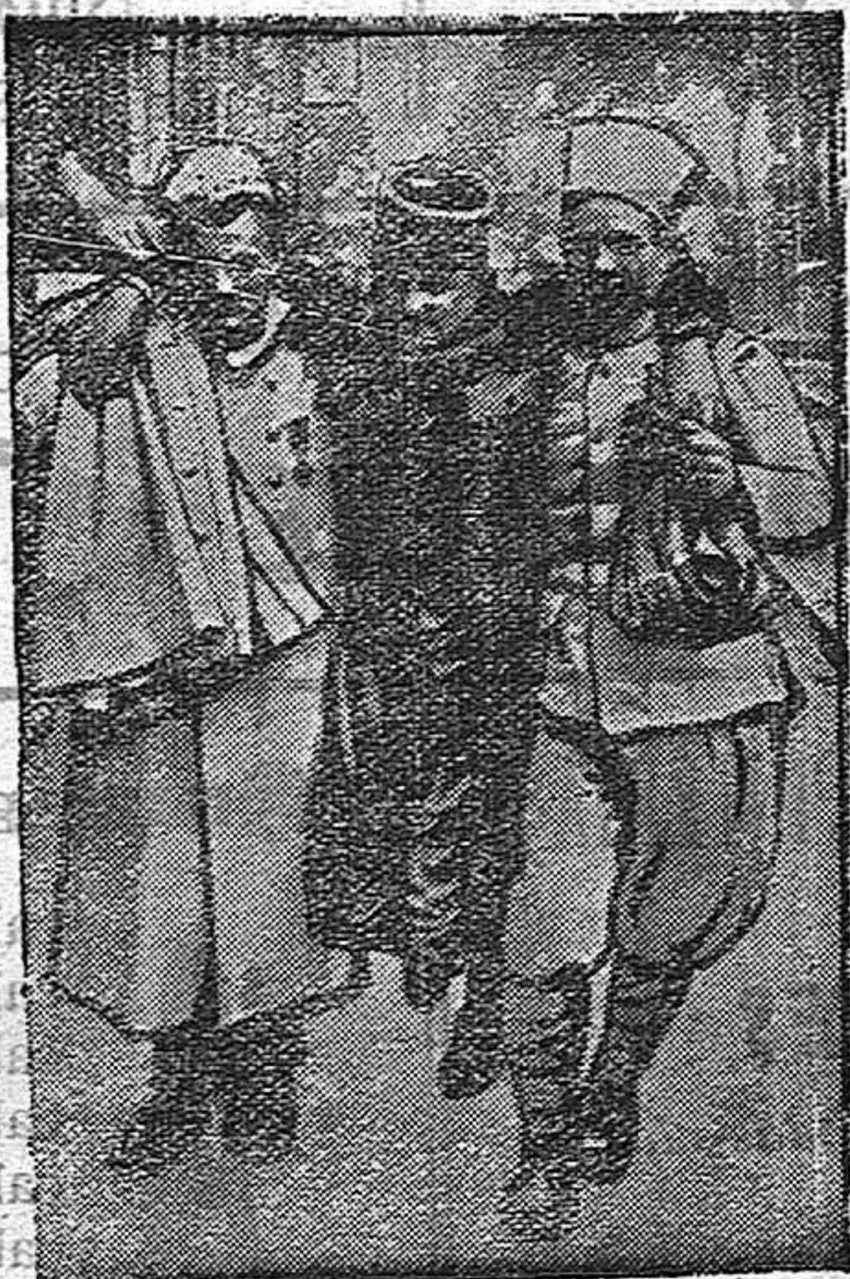
Soldados franceses en Atenas